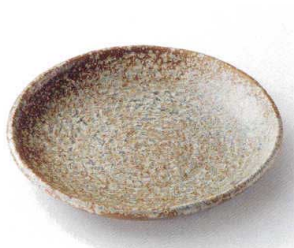
177-3-712 益子結晶7.0丸皿 770円 19.8×2.8cm 16509711