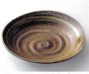
177-14-632 灰釉緑彩うず6.5皿 470円 20.5×4cm 60入 15918631