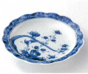
177-9-012 岩草花花割6.0皿 640円 19.1×3.2cm 17709012