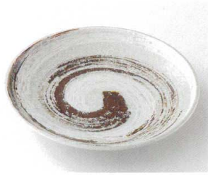
177-11-012 鳴門丸6.0皿 530円 19.3×2.7cm 17711012