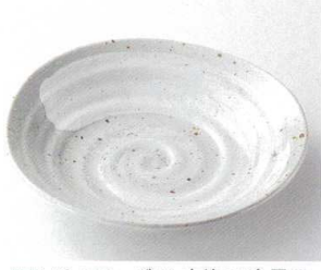
177-13-622 グリン古染6.8多用皿 480円 20.6×4.2cm 50入 16515621