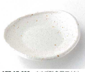
177-17-502 たまご型多用皿(白) 490円 18.6×16.3×3.2cm 17717502