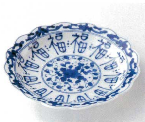
177-7-702 福づくし花割6.0皿 620円 19×3cm 17707702