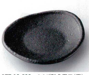
177-18-502 たまご型多用皿(黒) 490円 18.6×16.3×3.2cm 17718502