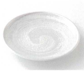
177-10-012 白雪丸6.0皿 530円 19.3×2.7cm 17710012