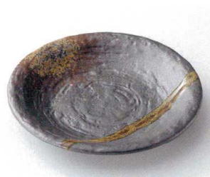
177-4-352 南蛮吹流し石目6.0皿 690円 19.8×2.8cm 16510351