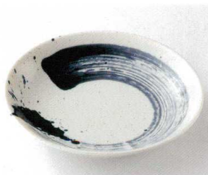
177-1-522 白一文字6.5深皿 720円 20.2×3.8cm 15715521