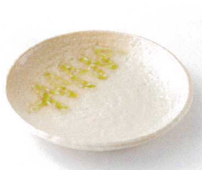
177-2-712 ビードロ7.0丸皿 770円 20×2.8cm 16504711