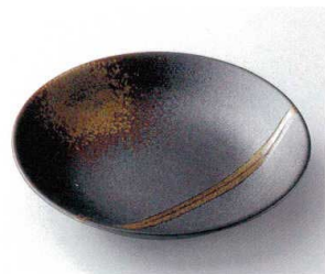
177-5-352 南蛮吹流し6.0皿 680円 20.2×3.7cm 16513351