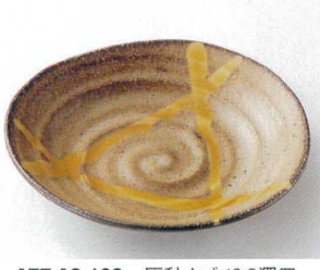
177-19-622 灰釉カゴメ6.8深皿 470円 20.5×4cm 30入 15923621