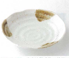
177-16-622 白唐津刷毛目7.0楕円皿 480円 20.5×19.5×3.8cm 50入 16514621