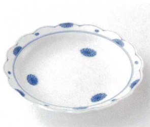
177-6-702 藍菊紋花割6.0皿 620円 19×3cm 17706702