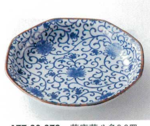
177-20-372 花唐草八角6.0皿 380円 18.8×3.5cm 16518371