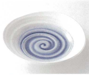
177-12-282 紫クリスタル6.5深鉢 500円 20.5×4.2cm 50入 15717281