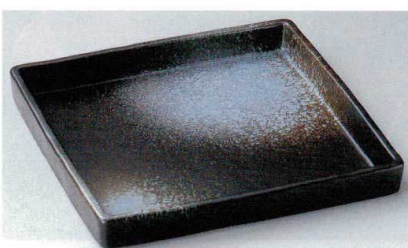
202-18-522 茶しぶき切立正角大皿 2,450円 24.5×24.5×3cm 17913521