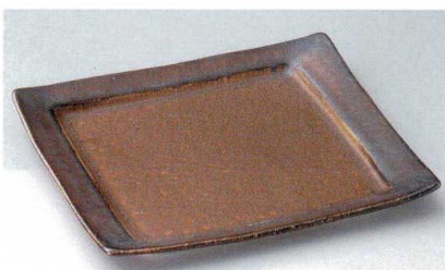
202-13-712 飴角大皿 2,750円 24.5×23.2×3cm 20213712