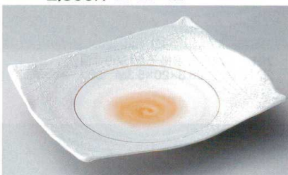
202-9-552 一珍ラスタールク口長皿 3,100円 24.6×20.7cm 30入 18008551