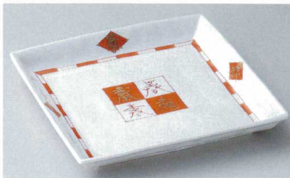
202-2-712 赤絵福来8.0角皿 4,500円 24.2×24.2×3.5cm 13503711