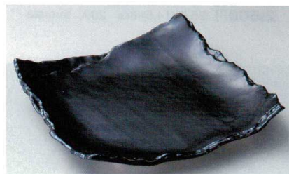
202-7-202 黒マット重ね8.5皿 3,600円 24×24×4.3cm 17904201