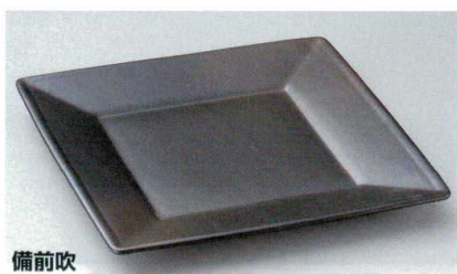
202-14-522 四方皿(大) 2,500円 24.5×24.5×4.7cm 17910521 202-15-522 四方皿(中) 1,450円 20.3×20.3×3.7cm 17909521