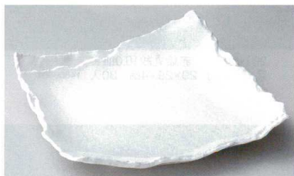
202-8-552 白マット重ね8.5角皿 3,400円 25.6×25×5.5cm 15入 17812551