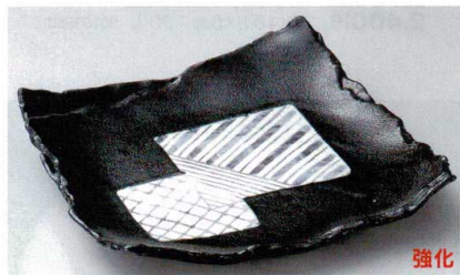
202-4-552 黒織部8.0角皿 4,500円 25.2×24×2.7cm 18203551