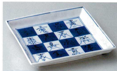
202-3-712 慶福8.0角皿 4,500円 24.2×24.2×3.5cm 13504711