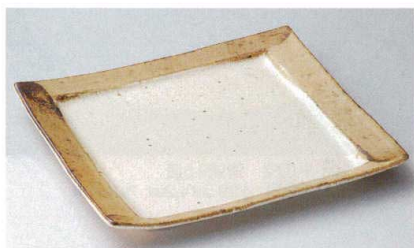
202-12-502 回角大皿(駱駝) 2,850円 24.5×23×2.8cm 20212502