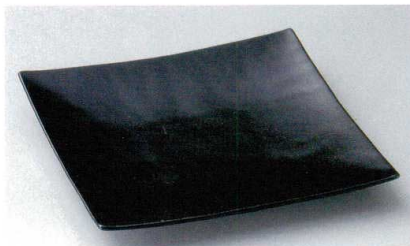
203-14-722 黒釉スクエア大皿 1,800円 23×23×3.5cm 18417721