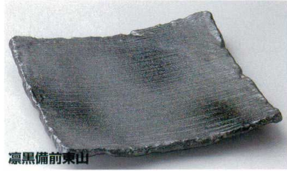
203-2-052 正角皿(大) 2,200円 22.5×22.5×2cm 18302051 203-3-052 正角皿(小) 1,200円 18.5×18.5×2cm 18301051