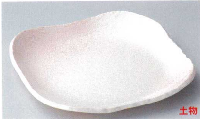
203-1-782 桜志野盛皿 2,350円 24.5×24.5cm 15306781