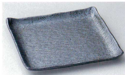
203-13-052 木肌正角皿 1,750円 23.8×23.8×2cm 18312051