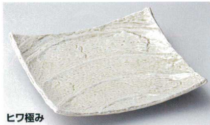
203-4-052 23cm正角皿 2,200円 23.5×23.5×3cm 17915051 203-5-052 19cm正角皿 1,200円 18.5×18.5×3.5cm 17914051