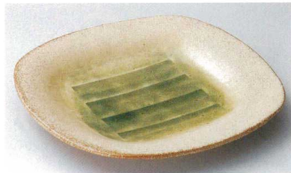
203-15-372 さび織部四角9.0皿 1,480円 26.2×26.2×3cm 15106371