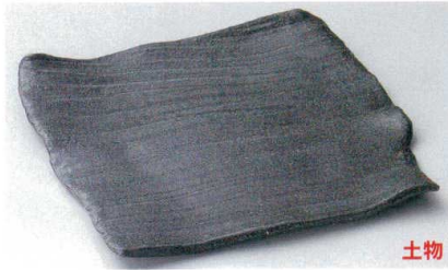
203-10-812 雪志野8.0正角皿(萬古焼) 1,900円 24×24×3.2cm 18105811