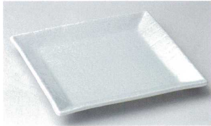
203-9-632 青磁四角大皿 2,000円 24×2.5cm 18107631