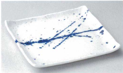
203-8-652 呉須吹角皿 2,200円 24×24×2.5cm 20308652