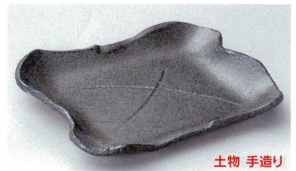
204-6-552 正角23cm皿 2,950円 23×2.5cm 20入 20406552 204-7-552 正角16.5cm皿 1,890円 16.5×2.4cm 60入 20407552