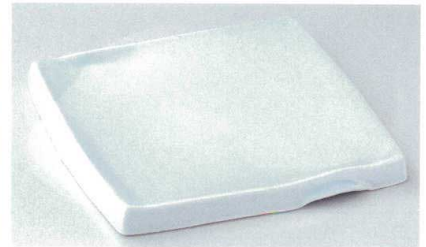
204-3-202 青白磁スクエア(大) 3,450円 24×23×3cm 18007201