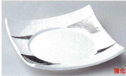
204-2-252 白磁プラチナ7.5寸四方皿 4,100円 22.3×22.3×4.5cm 18406251