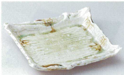
204-15-202 ビードロガタ彫四角皿 2,450円 22.1×20.6×4.4cm 20415202