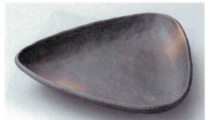
204-16-272 備前三角皿(大) 2,400円 23.5×23.5×4cm 24702271