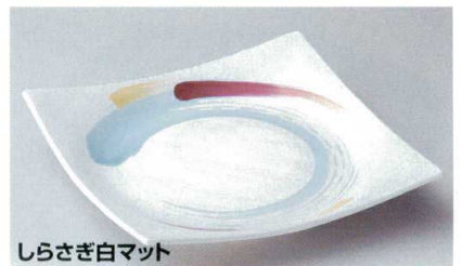
204-18-722 10.0正角皿 2,300円 23×23×3cm 20418722 204-19-722 6.0正角皿 1,100円 17.5×17.5×2.8cm 20419722