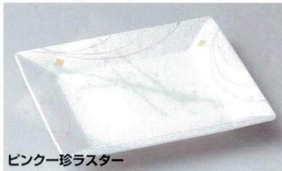
204-4-052 角皿(大) 3,000円 23×23×2cm 20404052 204-5-052 角皿(中) 2,300円 18.5×18.5×2cm 20405052