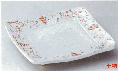
204-1-512 粉引花唐草正角皿 5,700円 23.5×22.5×4cm 18201511