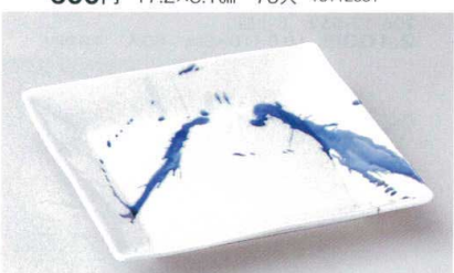
205-19-012 呉須流しスクエア(中皿) 1,400円 21.5×21.5×3cm 18512011