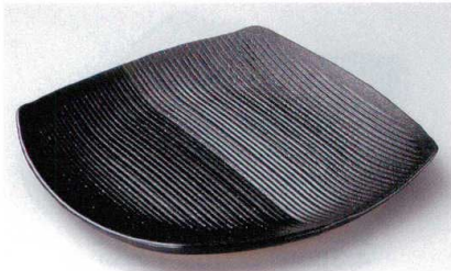
205-1-202 2way亀甲(黒)大皿 2,300円 23.8×23.8×2.9cm 18412201