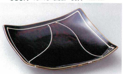
205-18-372 こはくLプレート 1,340円 22×22×4.7cm 18317371