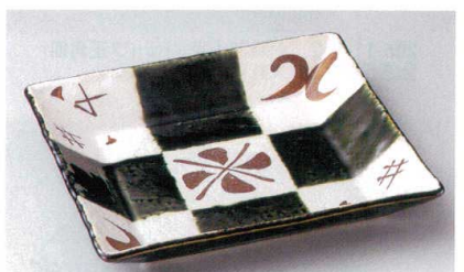
205-17-572 織部格子四角鉢(大) 1,400円 22.2×3cm 18313571