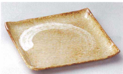
205-4-712 黄灰釉正角大皿 1,900円 23.6×23.6×2.6cm 20504712