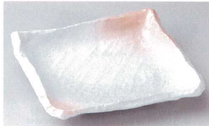
205-2-362 あげぼの匠23cm正角皿 2,260円 23×23×3.7cm 20502362