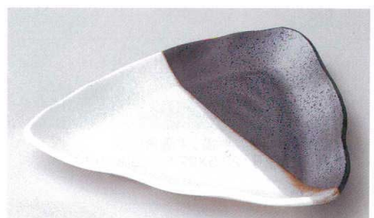
205-7-712 塗分三角盛皿 1,860円 23.7×23.2×2.5cm 20507712