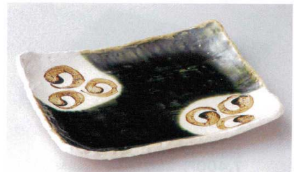
205-3-792 おりべ丸 正角皿 2,200円 23.5×20.7×3.3cm 18213791