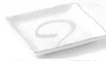
213-19-502 アジアン粉引正角皿 620円 16.3×16.3×2cm 18925501