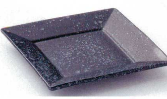
213-16-632 銀彩黒16cm角皿 710円 16×16cm 18927631 213-17-632 銀彩黒13cm角皿 600円 13×13cm 18926631