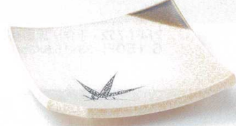
213-6-302 石焼オリベ正角17cm皿 950円 17×3cm 17707301