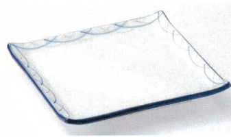
213-10-712 二色むさしの正角皿 800円 17×17×3cm 19123711