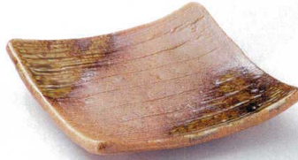
213-2-212 織部掛正角菜皿 1,100円 16.3×16.3×3.8cm 19111211