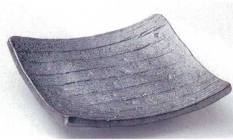
213-7-202 南蛮5.5正角菜皿 900円 16.5×16.5×3.8cm 19117201