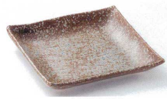
213-12-712 益子結晶正角皿 770円 17.2×17.2×2.7cm 18924711