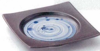
213-5-282 漆染リップル15cm角皿 950円 15.4×2.2cm 80入 21305282