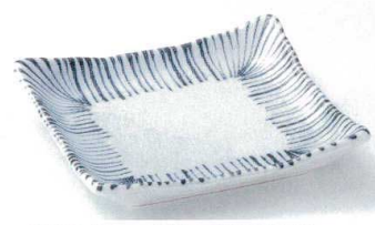
213-9-712 千筋十草6.0正角皿 850円 16.7×16.7×3.5cm 21309712