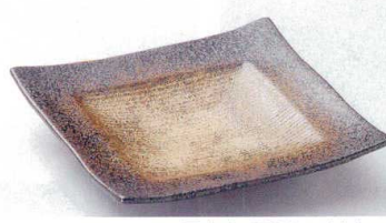
213-18-722 黒窯変千段角皿(小) 640円 15×15×3.2cm 21318722