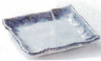
213-8-792 淡青5.0正角皿 880円 14.7×15×2.5cm 21308792