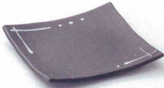
213-1-502 天目点線正角中皿 1,100円 16.5×2cm 21301502