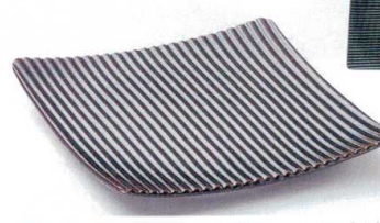
213-15-012 いぶし天目縞目ひし形皿(大) 720円 17×17×1.5cm 18923011