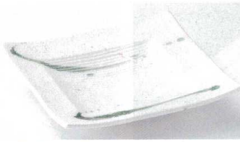
213-11-202 白クシメ角皿 小 720円 15.3×15.3×3.2cm 21311202