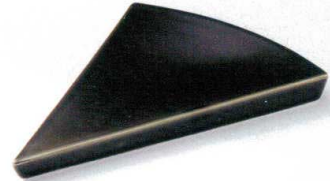
213-3-522 織部三角前菜皿 1,050円 20.8×16×1.6cm 21303522