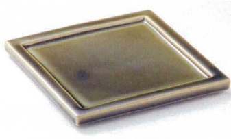
213-13-272 鉄織部角皿 中 760円 14×14×1.5cm 18703271