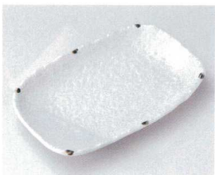
254-8-722 粉引水玉8.0焼物皿 800円 22.7×14.7×2.8cm 21609721 254-9-722 粉引水玉7.0焼物皿 580円 19.8×13.2×3.1cm 21710721