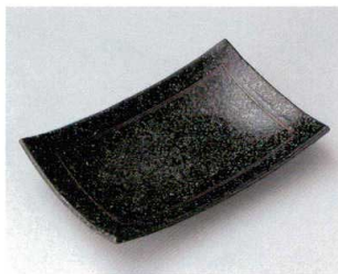
254-6-512 油滴黒四ツ足 焼物皿 800円 20×13.2×3.2cm 21515511