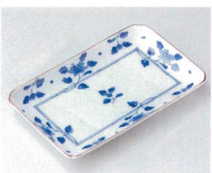
254-22-652 染小花焼皿 750円 22.3×13.8×2.3cm 21623651