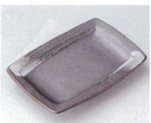
254-18-782 鉄結晶ナデ角焼物皿(中) 760円 20.5×14.3×2.9cm 55771781 254-19-782 鉄結晶ナデ角焼物皿(小) 600円 18.7×13×2.5cm 55770781