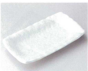
254-17-012 白四ツ足長角皿 760円 21.5×11.5×2.2cm 25417012