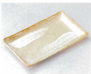
254-16-712 黄灰釉8.0焼物皿 770円 23.6×14.2×2.3cm 25416712