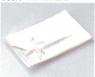
254-10-712 志野芦8.0焼物皿 800円 23×15×2cm 21519711 254-11-712 志野芦6.0焼物皿 380円 17.5×12×2.2cm 21518711