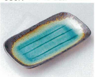
254-15-562 ヒスイ小判焼物皿 780円 24×13.5×2.4cm 21611561