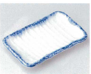
254-20-552 呉須刷毛焼物皿 750円 22×13.8×2.3cm 21624551