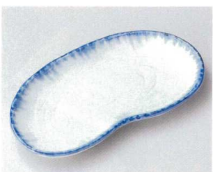
254-21-552 呉須刷毛空豆型焼物皿 750円 21.5×11.5×1.8cm 21703551