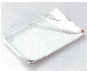
254-13-702 織部ストライプ7.0皿 780円 20.5×13×2cm 25413702