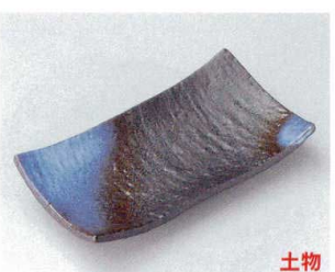
254-23-782 青雲7.0焼物皿 700円 20×13.7cm 25423782