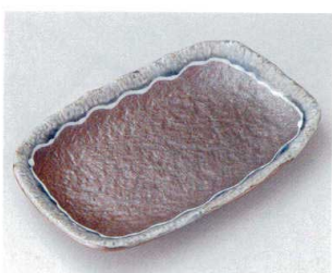
254-4-722 南蛮測流し8.0焼物皿 800円 22.7×14.7×2.8cm 21517721 254-5-722 南蛮測流し7.0焼物皿 580円 19.8×13.2×3.1cm 21711721