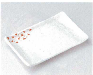
254-14-722 紅志野唐草7.0長角皿 780円 20.5×13×2.3cm 21604721