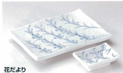
花だより 261-10-712 8.0長角皿 1,000円 21×14.6×2.9cm 22122711 261-11-712 角千代久 360円 9.2×6.5×3cm 22123711