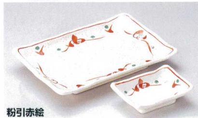
粉引赤絵 261-16-602 7.0焼物皿 960円 21.5×14.5×3.2cm 50入 22021601 261-17-602 角千代久 480円 10×7.2×3cm 100入 22022601