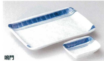
鳴門 261-24-712 8.0長角皿 940円 22×15×3cm 22205711 261-25-712 角千代久 350円 9.5×6.5×3cm 22206711