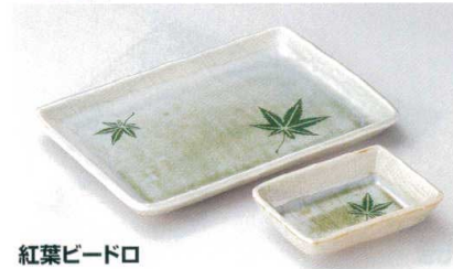
紅葉ビードロ 261-18-582 7.0焼物皿 950円 20.7×14.3cm 26118582 261-19-582 長角千代久 400円 10.5×7.4×2.5cm 26119582