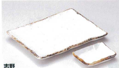
志野 261-3-712 8.0焼物皿 1,100円 21.5×16×2cm 22109711 261-4-712 7.0焼物皿 900円 20.4×14.2×2cm 22110711 261-5-712 角千代久 350円 9.5×7.2×2cm 22111711