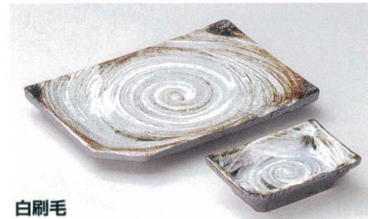
白刷毛 261-12-622 7.0焼物皿 1,040円 18.8×13×2.2cm 40入 22116621 261-13-622 長角千代久 440円 9.5×6.1×2.8cm 150入 22117621