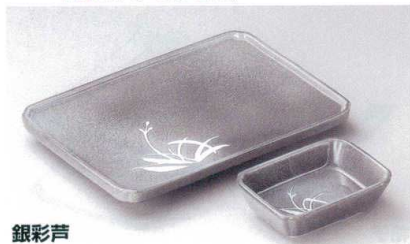
銀彩芦 261-14-782 8.0皿 980円 20.5×14×2.3cm 22124781 261-15-782 小皿 320円 9.5×6.6×3cm 22125781