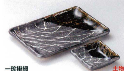
一珍掛網 土物 261-6-722 7.0焼物皿 1,070円 20.4×14.3×2.2cm 21927721 261-7-722 角千代久 390円 8.4×8.4×2.5cm 21928721