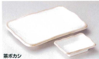
茶ボカシ 261-22-682 焼物皿 950円 21×14.5×2.2cm 22118681 261-23-682 千代久 340円 10×7.2×2.3cm 22119681