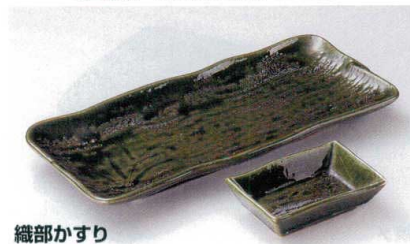
織部かすり 261-28-602 長角皿 900円 27×12×2.5cm 40入 19914601 261-29-602 角千代久 400円 10×7×3cm 100入 26129602