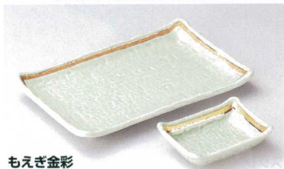
もえぎ金彩 261-8-752 7.0焼物皿 1,050円 20×12.7×2.2cm 22019751 261-9-752 角千代久 450円 9×6.3×2.4cm 22020751