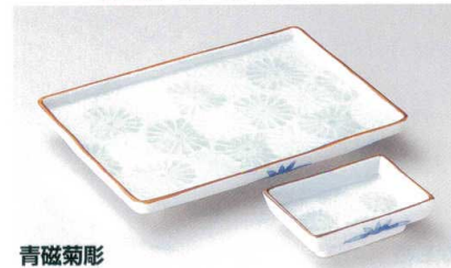
青磁菊彫 261-30-732 焼物皿 900円 20×14×2.4cm 26130732 261-31-732 角千代久 250円 9×6.3×3cm 26131732