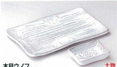
木目ウノフ 土物 261-1-782 9.0焼物皿 1,100円 24.5×15cm 22015781 261-2-782 小皿 310円 9.5×6.8cm 22016781