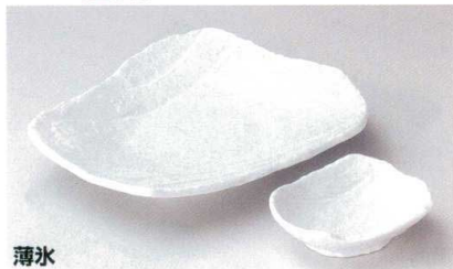
薄氷 261-20-522 前菜皿 950円 20.5×16.8×3.3cm 26120522 261-21-522 千代久 480円 10.1×8.5×3.2cm 26121522