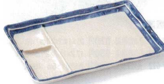
264-11-712 刈ライン串皿(大) 800円 22.4×14.8×2.5cm 23504711