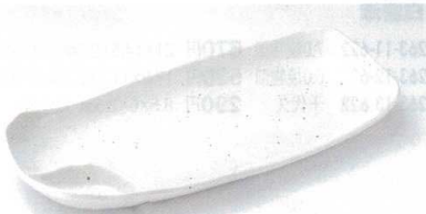
264-7-352 白粉引仕切トレー 1,100円 33.7×15×4.3cm 26407352