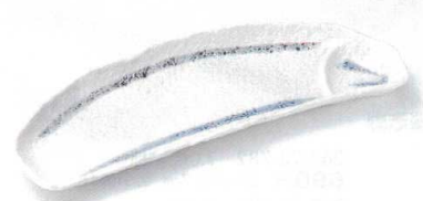
264-15-502 おふけ半月仕切さんま皿 700円 27×12.5×2.8cm 23505501