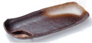
264-6-352 黒水晶仕切トレー 1,100円 33.7×15×4.3cm 23411351