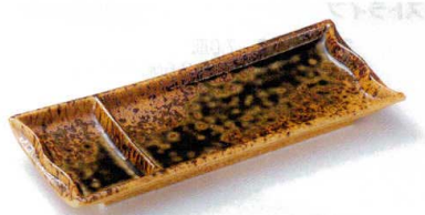
264-8-622 伊賀の里竹割仕切皿(大) 990円 24.8×9.5×2.7cm 40入 23415621