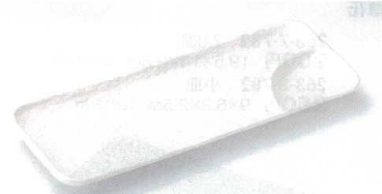
264-9-772 大戸志野仕切付さんま皿 800円 30.2×12×2.3cm 26409772