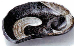
264-2-622 白刷毛貝型仕切皿 1,430円 21.5×17×3.7cm 30入 23404621