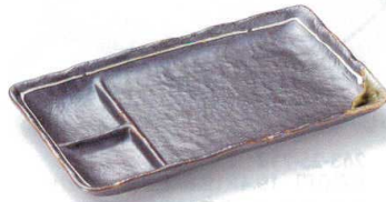
264-14-752 鉄釉一珍ライン串皿 720円 22×12.1×2.5cm 26414752