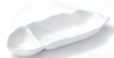
264-18-532 白釉木の葉仕切皿 530円 27.4×10.5×4cm 23515531