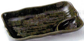
264-10-602 織部がすり7.0仕切皿 830円 21×13×3cm 26410602