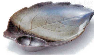
264-5-512 森の湖木の葉仕切皿 1,200円 24×17×3.5cm 26405512