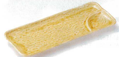
264-12-772 黄瀬戸仕切付さんま皿 800円 30.2×12×2.3cm 26412772