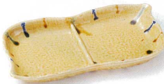
264-16-712 キセト十草枝豆皿 600円 23×12.7×2.5cm 23513711