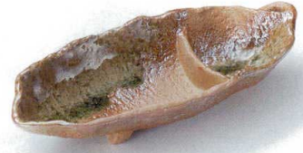
264-3-512 織部砂目仕切鉢 1,400円 23×10×4.6cm 23406511