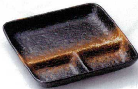
264-13-512 黒備前7.0三ツ切皿 780円 17.4×16.6×3cm 23507511