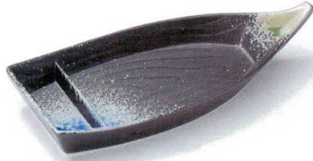
264-1-622 しぶき舟型刺身皿 1,590円 26.4×11.5×3cm 20入 23403621