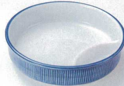
265-11-712 呉須巻仕切多用鉢 700円 16×4.3cm 23503711