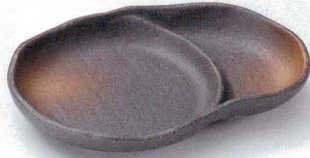
265-10-202 黒伊賀仕切皿 780円 17.2×12.2×2.5cm 23508201