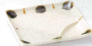
265-15-722 洩織部十草7.0仕切皿 570円 17.3×15.2×2.4cm 23511721