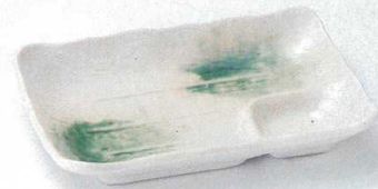
265-18-572 白釉織部吹仕切皿 360円 16.7×11.5×2.8cm 23518571