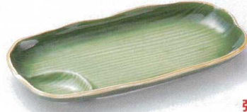
265-2-702 緑彩仕切付焼物皿 1,280円 23×11.3×2.5cm 1入 23405701