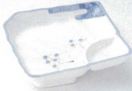
265-4-712 白吹松仕切皿 1,100円 15.8×15.8×4cm 23409711