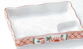
265-12-612 祥瑞仕切皿 650円 15.5×12×3cm 23509611