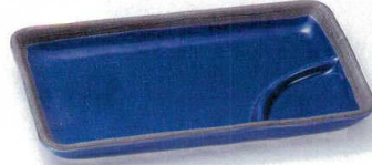
265-8-712 桃山青華7.0仕切皿 820円 20.1×12.5×2cm 23501711