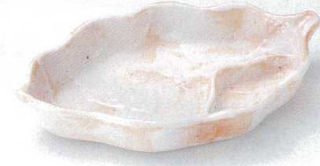
265-6-622 桜志野葉型仕切皿 970円 21.6×13×2.8cm 40入 23417621