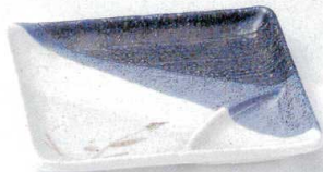
265-14-722 半掛苜7.0仕切皿 570円 17.2×14.9×2.3cm 26514722