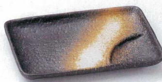
265-17-512 黒備前6.0仕切皿 400円 17.6×12×2.3cm 23517511