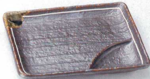
265-13-752 鉄釉一珍ライン7寸仕切皿 600円 17×14.8×2.4cm 26513752