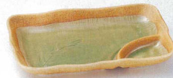
265-9-602 緑彩苜7.0仕切皿 800円 21×13×3cm 50入 23502601