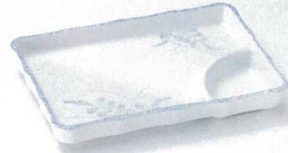
265-3-782 マット萩7.0長角仕切皿 1,150円 19×13×2.6cm 23416781