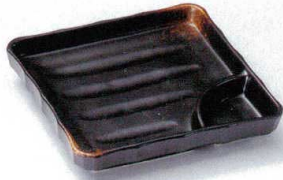
265-1-782 焼締正角仕切皿 1,280円 17×17×3cm 23410781