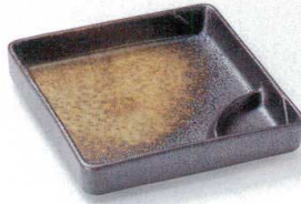
265-5-672 伊賀天目仕切皿 1,100円 16.5×16.5×3cm 23413671