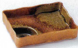
265-16-672 伊賀仕切皿 520円 14.8×11.7×3cm 23514671