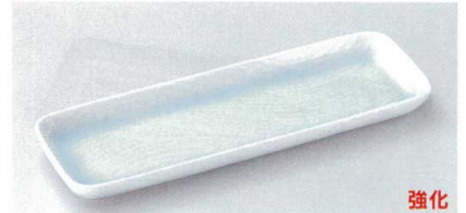
270-6-712 青白磁波彫突出皿 1,060円 23×7.8×1.6cm 22909711