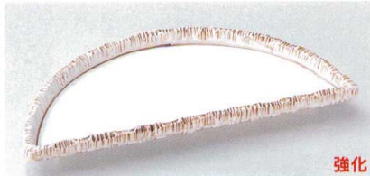
270-4-712 茶淵巻半月突出皿 1,100円 20.5×9.6×2cm 27004712