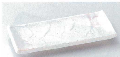
270-14-622 桜志野突出皿 1,020円 22.7×10×3cm 60入 22913621