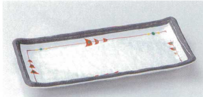
270-5-782 瀏黒赤絵突出皿 1,080円 21.5×10cm 22905781