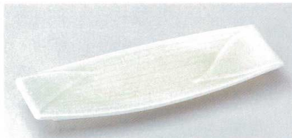
270-7-672 もえぎ折笹突出皿 1,050円 23.5×9×2cm 23009671