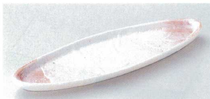
270-16-622 桜志野舟型突出皿 990円 25.6×7.9×1.8cm 60入 22918621