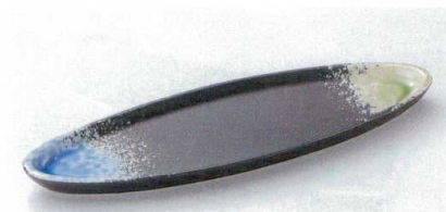
270-13-622 しぶぎ舟型突出皿 1,020円 25.6×7.9×1.8cm 60入 22917621