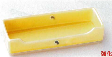
270-2-782 黄輝一品盛 1,100円 17.5×6.5×3.5cm 22906781