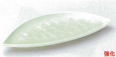
270-1-782 ヒワ花紋突出皿 1,150円 22×9×1.5cm 22908781