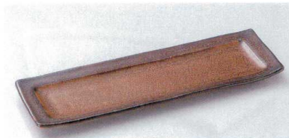
270-8-712 鯨突出皿 1,050円 28×8.8×1.8cm 27008712