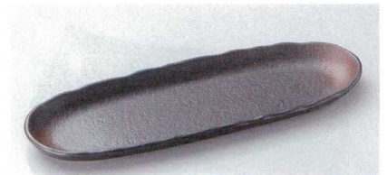
270-9-672 備前風長小判皿 1,050円 28.7×9.7×2cm 23004671