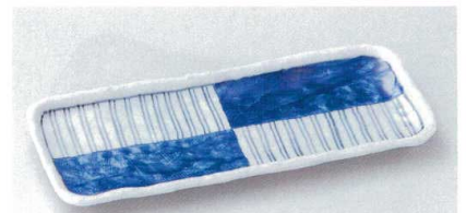
270-15-732 京ごのみ突出皿 1,000円 22.7×9.6×1.6cm 23007731