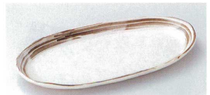
270-18-792 くりちよこ小判多用皿 980円 25.3×12.7×1.2cm 23017791