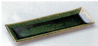
270-10-362 織部長角8.5寸皿 1,050円 26×9×2.4cm 27010362