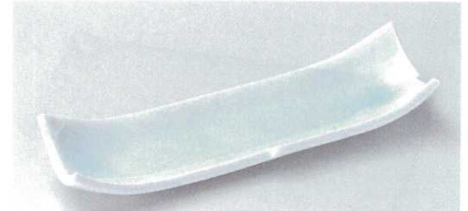
270-3-212 青白瓷切込突出皿 1,100円 23.5×7.3×3.5cm 23005211