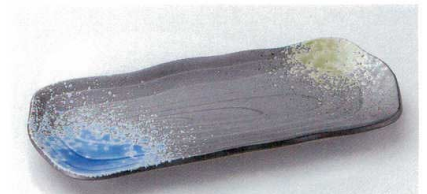
270-12-622 しぶぎ突出皿 1,020円 24.5×10.5×2cm 50入 23001621