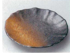
281-15-052 黒備前吹フレア5.0皿 380円 15.7×2.3cm 25630051