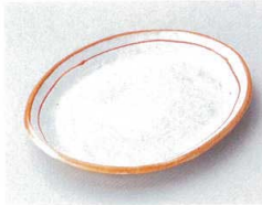
281-1-792 晴美4.0小判皿 560円 15.8×12.3×1.6cm 25519791