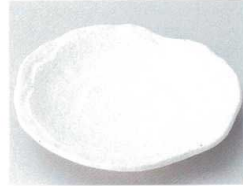
281-25-672 ハンテンフルーツ皿 230円 15.5×2.4cm 25330671