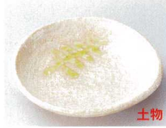
281-3-782 ピード口5.0丸皿 540円 15×2.5cm 90入 25726781