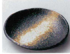
281-9-512 黒備前5.0皿 480円 15.2×2.5cm 25320511