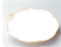
281-30-052 マーブル志野4.8皿 250円 15×2cm 25716051