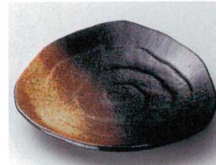
281-17-052 黒備前吹三角5.0皿 400円 16.3×2.8cm 25313051