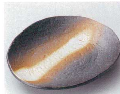
281-16-502 備前風変型皿(小) 420円 15.5×13×2.5cm 25526501