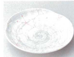
281-28-012 桜印5.0平皿 280円 16×2.6cm 28128012