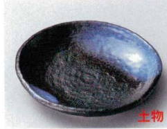
281-2-782 青雲5.0丸皿 550円 15×2.6cm 28102782