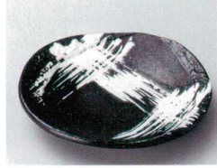
281-4-052 白刷毛石目取皿 540円 15.8×14.5×2.8cm 25518051