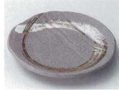
281-20-502 土物うず取皿 380円 15.5×2cm 25310501