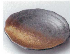
281-23-372 黒備前吹き銘々皿 360円 15.2×14.5cm 25528371