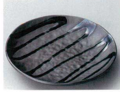
281-10-372 ひるがの5.0皿 400円 15×2.5cm 25727371