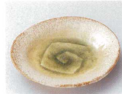
281-29-372 さび織部檜門うず4.8皿 270円 15×13.5×2.2cm 25522371