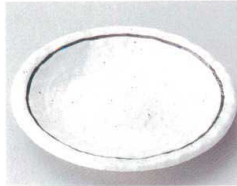
281-6-552 粉引5.0フルーツ 530円 16.3×2.4cm 25309551