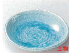
281-12-722 トルコ5.0フルーツ皿 460円 15.3×2.6cm 25524721