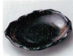
281-18-502 天目白刷毛小判型取皿 390円 16×13×2.6cm 28118502