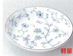
281-19-012 線唐草軽量5.0皿 380円 16.5×3.5cm 28119012