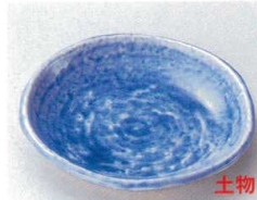
281-11-782 ブルー5.0丸皿 460円 15.2×2.3cm 25525781