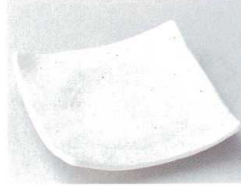
281-8-502 グレー引スクエア-Mプレート 490円 13.3×2.5cm 25314501