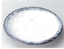
281-5-622 なごり雪石目5.0皿 530円 16.3×2.5cm 25315621