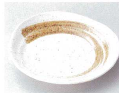
281-26-772 一本刷毛目 鑄彩華5.0皿 300円 16.7×2.8cm 28126772