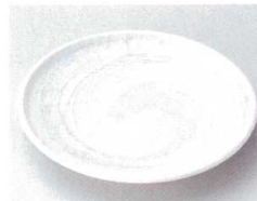
281-21-012 白雪丸5.0皿 380円 16.8×2.3cm 28121012