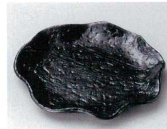
281-22-552 ブラック取皿 370円 15.5×2cm 80入 28122552