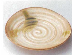
281-24-652 こげ茶5.0皿 330円 16.4×3.2cm 28124652