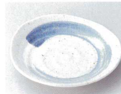
281-27-772 一本刷毛目 青彩華5.0皿 300円 16.7×2.8cm 28127772