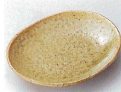
281-13-712 黄唐津5.0小判皿 450円 16.5×13×2.9cm 25325711