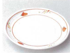
281-14-052 平安5.0皿 390円 16.4×2cm 25321051