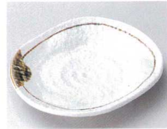
283-25-722 志野織部掛茶筋小判和皿 420円 15.3×13.2×2.3cm 28325722