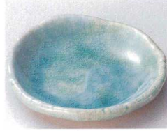
283-4-722 手造り風トルコ5.0丸皿 670円 15×2.5cm 28304722