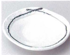
283-11-522 黒結び5寸皿 580円 15.6×14.6×2.9cm 25710521