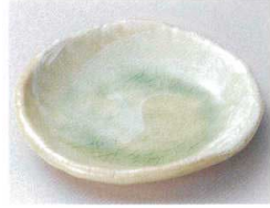
283-10-712 彩り(グリーン)5.0丸皿 600円 15×14.5×2.7cm 25516711