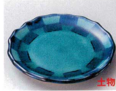
283-14-712 市松5.0フルーツ皿 570円 15.5×2cm 25514711