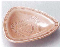
283-16-212 ピンク線彫5.0三角皿 520円 15×3cm 25308211