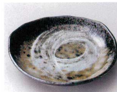
283-28-502 白刷毛金吹変形5.0皿 300円 15.6×2.7cm 28328502