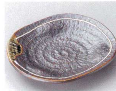
283-24-752 鉄袖一珍ライン小判和皿 430円 15.2×13.2×2.4cm 28324752