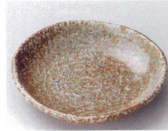
283-19-712 益子結晶5.0皿 480円 15×2.5cm 28319712