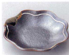
283-21-752 鉄袖一珍ライン5.0フルーツ皿 470円 15.2×2.8cm 28321752