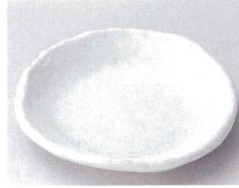
283-9-712 白均窯5.0皿 600円 15×2.7cm 28309712