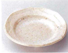
283-2-212 うのふ三ツ足15cm皿 680円 15×3.2cm 28302212