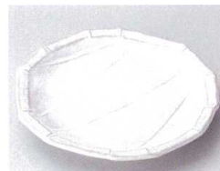
283-27-352 白斑点銘々皿 300円 15.2×2cm 28327352