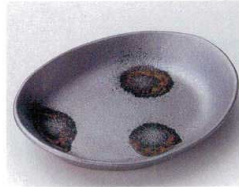
283-13-052 南蛮吹樽円取皿 580円 15×12.2×2.5cm 25511051