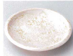
283-30-752 夢口マンくり手4寸皿 300円 14.1×2.1cm 28330752