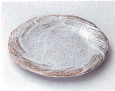
283-1-512 さざなみ5.0皿 700円 16.5×1.8cm 28301512