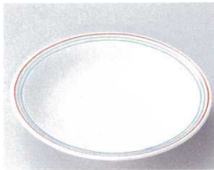
283-6-212 三色ライン高台フルーツ皿 660円 15×3.3cm 28306212