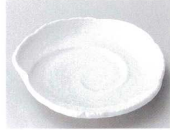
283-15-672 白シエル銘々皿 540円 15×2.7cm 28315672