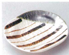
283-26-722 織部錆十草6.0小判皿 380円 15.5×13.5×2.4cm 28326722