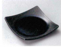
283-5-522 黒碧四方皿(小) 660円 14.8×14.8×2.7cm 25703521