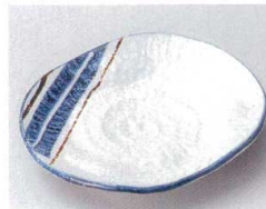
283-23-702 ボタ袖ライン小判和皿 460円 15×13×2.2cm 28323702