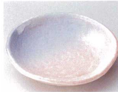
283-18-712 紅袖5.0丸皿 500円 15×2.5cm 25722711