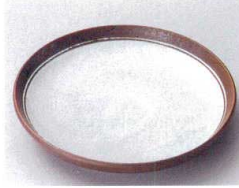
283-3-352 南蛮粉引5.0皿 680円 16.1×2.6cm 26645351