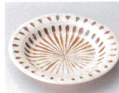
283-29-352 うず十草4.5皿 280円 15.3×2.2cm 25527351