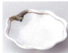
283-22-722 志野織部掛茶筋5.0フルーツ皿 460円 15.3×2.7cm 28322722