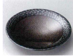
283-20-032 ショコラ取皿 470円 15.5×2.5cm 28320032