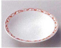
283-8-212 手描き唐草高浜50皿 620円 15×3.2cm 28308212