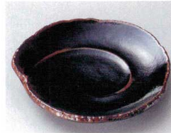
283-12-032 赤土天目シエル銘々皿 600円 15.5×3.5cm 28312032