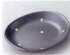
283-7-352 黒ゆず黄水玉銘々皿 620円 15×12.2×2.5cm 28307352