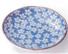
287-28-372 梅小花3.5皿 ブルー 210円 12.4×2.2cm 26123371