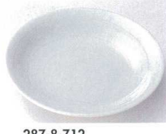
287-8-712 やすらぎ銘々皿 480円 13.2×1.8cm 25917711