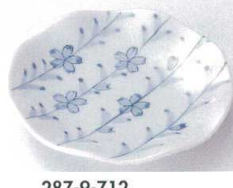
287-9-712 花だより4.0丸皿 470円 12×2.2cm 26030711