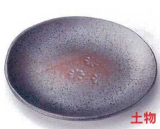
287-2-212 黒釉印花丸小皿 570円 13×1cm 26021211