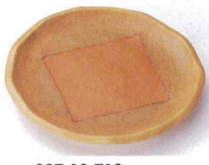
287-13-712 いろ紙銘々皿 430円 13×1.8cm 25919711