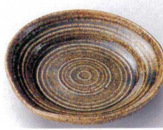
287-29-502 織部片口三ツ足4.5皿 200円 13.5×3cm 25929501