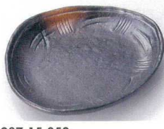
287-15-052 黒備前金茶吹三角小皿 400円 13.7×11.5×2cm 120入 26105051