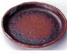
287-11-502 柚赤吹霰変取皿 450円 13.8×1.8cm 28711502