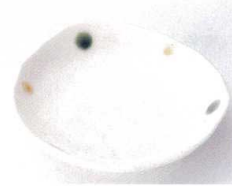
287-26-372 ドット三角3.5皿 220円 12×2.5cm 26122371