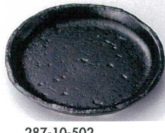
287-10-502 黒吹霰変取皿 450円 13.8×1.8cm 28710502