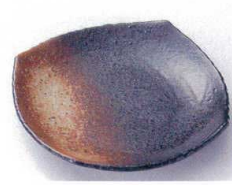
287-21-052 黒備前吹4.0銘々皿 300円 12.5×12.5×2.3cm 26115051