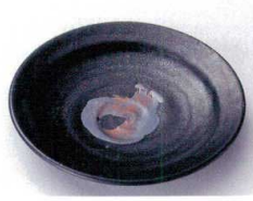
287-23-502 いぶし天目取皿 280円 13.6×2cm 25927501