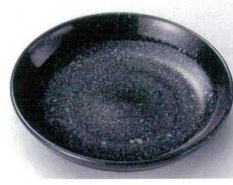
287-25-302 黒油滴4.5皿 260円 13.4×2.8cm 26118301