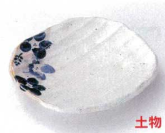
287-1-712 藍花4.0皿 580円 12.8×11×2cm 28701712