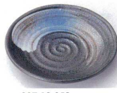
287-19-052 黒結晶4.5皿 300円 14×2.5cm 28719052