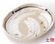
287-4-712 織部流取皿 550円 15×12×2cm 25515711