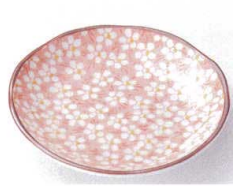
287-27-372 梅小花3.5皿 ピンク 210円 12.4×2.2cm 26124371