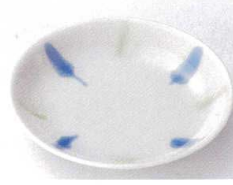
287-24-372 二彩貫入3.8丸皿 250円 12.4×2.1cm 26119371