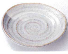
287-18-652 均霰粉引4.0皿 310円 13.3×2.5cm 28718652