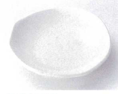
287-16-732 白結晶取皿 370円 12.6×12.6×3cm 26111731