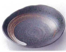
287-22-502 白刷毛天目精円皿(小) 290円 13×12×3.3cm 26128501