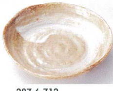
287-6-712 黄灰釉取皿 530円 13.9×3.2cm 28706712