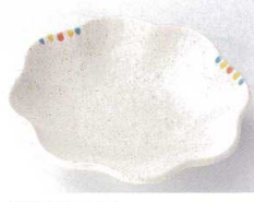
287-17-722 黄点遊び4.0波丸皿 370円 13.8×12.9×2.8cm 25923721