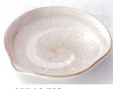
287-12-722 渦刷毛片口4.0皿 440円 13×12×3cm 28712722