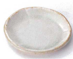
287-5-712 白雲4.0丸皿 530円 13×1.7cm 25915711