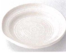
287-30-502 白片口三ツ足4.5皿 200円 13.5×3cm 25930501