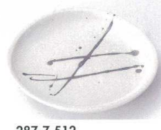
287-7-512 黒筆流粉引釉取皿 500円 13×13×1.7cm 28707512