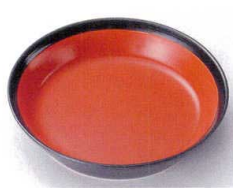
287-3-212 じゃぼにか40深皿 560円 12.2×2.7cm 28703212