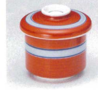
327-28-782 赤巻筋小むし碗 900円 8.4×8cm(160cc) 31518781