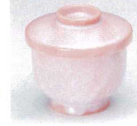
327-34-252 赤唐津小むし碗 840円 6.6×7.1cm(120cc) 32734252