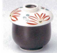
327-15-722 南蛮赤絵小むし碗 1,150円 6.9×7.7cm(160cc) 31436721