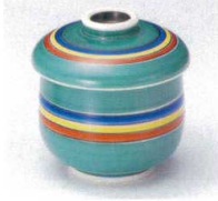
327-6-782 グリーン巻七宝むし碗(小) 1,350円 7.7×8cm(150cc) 31435781