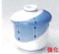
327-9-712 ブルー水玉小むし碗 1,200円 7.5×8.8cm(140cc) 31433711