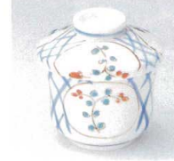
327-27-722 アイボリー萩小むし碗 920円 7.3×8.5cm(180cc) 31607721