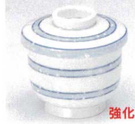
327-16-782 かすみ二本筋むし碗 1,100円 7.4×7.5cm(120cc) 32716782