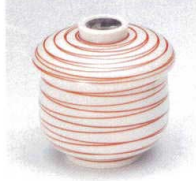
327-10-792 赤巻うずミニむし碗 1,200円 7.5×7.9cm(180cc) 31440791