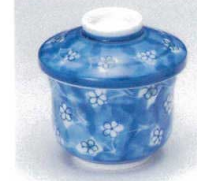
327-25-712 ダミ花唐草小むし碗 940円 8.3×8.3cm(200cc) 31311711