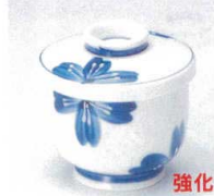
327-14-702 一珍青花むし碗 1,180円 7.5×7.5cm(100cc) 32714702