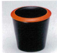
327-7-792 塗分赤黒むし碗 1,250円 7.7×7cm(140cc) 32707792