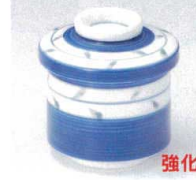
327-21-782 花つなぎむし碗 960円 7.7×8cm(160cc) 31501781