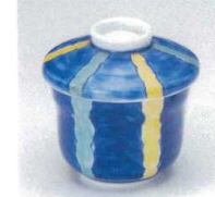
327-31-752 ダミ十草小むし碗 850円 7.3×8.5cm(150cc) 31513751