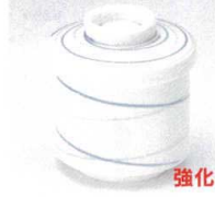
327-17-702 かすみ二色釉渦むし碗 1,080円 6.7×8cm(130cc) 32717702