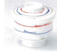
327-33-212 三色ライン小むし碗 850円 6.8×7.2cm(125cc) 31510211