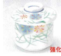
327-23-752 野花切立むし碗 950円 7×7.5cm(160cc) 32723752