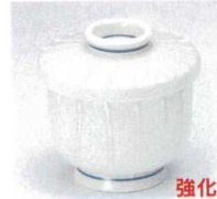
327-13-792 一珍十草むし碗 1,180円 8.5×7.5cm(140cc) 32713792