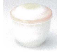
327-30-202 白磁2色吹むし碗(中) 880円 8×7.4cm(150cc) 31514201