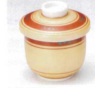
327-35-752 金彩赤駒筋むし碗 830円 7.1×8.5cm(150cc) 31625751