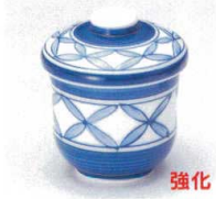
327-5-702 呉須巻七宝むし碗(小) 1,080円 6.3×8.8cm(120cc) 31438701