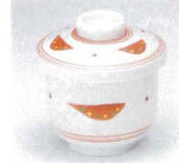
327-19-252 赤絵二色点ミニむし碗 1,000円 8.2×8.4cm(170cc) 31604251