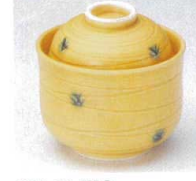
327-36-712 黄瀬戸草紋ダルマ型蒸碗 810円 8.5×7.5cm(150cc) 32736712