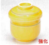
327-4-782 黄交趾むし碗 1,350円 7.5×8.4cm(150cc) 31430781