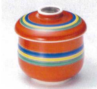
327-3-792 赤駒筋ミニむし碗 1,400円 7.5×7.9cm(180cc) 31429791