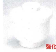
327-22-792 白マット釉むし碗 960円 8.5×7.5cm(140cc) 32722792