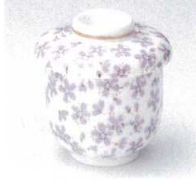
327-12-112 花むらさき小むし碗 1,200円 7.5×9cm(130cc) 32712112