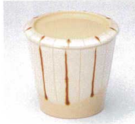
327-8-712 錆十草むし碗 1,250円 7.7×7cm(130cc) 32708712