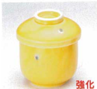
327-1-702 黄輝むし碗 1,450円 6.8×8.5cm(130cc) 31426701