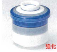
327-18-782 二色ラインむし碗 1,020円 7.7×8cm(160cc) 31437781