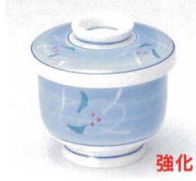
327-11-712 彫唐草むし碗 1,200円 7.5×7.5cm(110cc) 32711712