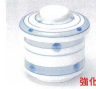
327-26-792 ダミラインむし碗 950円 8×7.8cm(170cc) 31509791