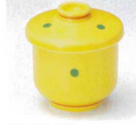
327-24-522 黄釉京型ミニむし碗 950円 8.5×8.1cm(140cc) 32724522