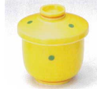
327-20-522 黄釉京型小むし碗 980円 8.3×8.8cm(170cc) 32720522