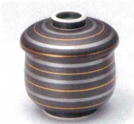
327-2-782 銀駒筋むし碗(小) 1,400円 7.7×8cm(150cc) 80入 31434781