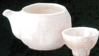
粉引 土物 331-11-212 冷酒 2,400円 12.5×9.5×8cm (330cc) 6入 32118211 331-12-212 ぐい呑 820円 6.8×4.5cm (55cc) 32119211