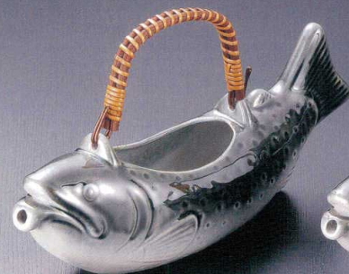
331-19-512 イワナ骨酒(大) 2,900円 31.5×9×11.5cm (800cc) 1入 33119512