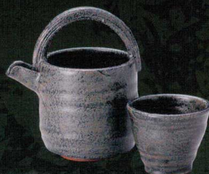
手造り黒釉 土物 331-13-212 酒器 2,300円 170cc 6入 32021211 331-14-212 ぐい呑 850円 6.7×5.3cm (75cc) 32022211