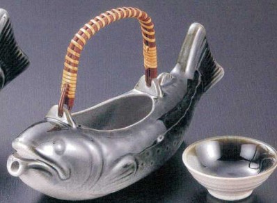
331-20-512 イワナ骨酒(小) 2,600円 28.5×8.7×10.5cm (500cc) 1入 33120512 331-21-512 イワナ大盃 350円 8.5×3.5cm (90cc) 60入 33121512