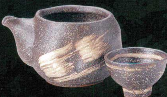
焼ダ白刷毛 土物 331-15-212 冷酒 2,400円 330cc 6入 32113211 331-16-212 ぐい呑 820円 6.8×4.5cm (55cc) 32114211