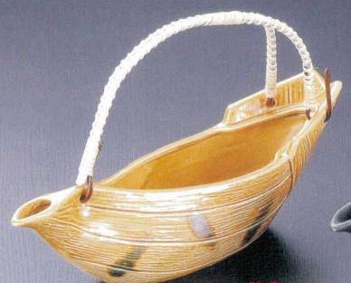
331-22-712 黄瀬戸骨酒 3,700円 28.5×7.8×9.2cm (500cc) 33122712