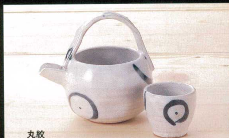
丸紋 331-1-212 手付酒器 2,400円 220cc 32120211 331-2-212 丸ぐい呑 950円 土物 手造り 6×5.5cm (70cc) 32121211