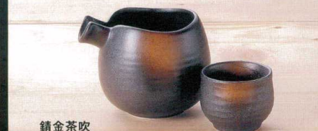
錆金茶吹 331-5-502 冷酒器 980円 9×8cm (250cc) 20入 32017501 331-6-502 冷酒杯 390円 5.8×4.7cm (75cc) 32018501