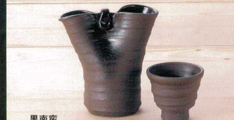
黒南蛮 331-7-362 とじめ酒器 3,000円 11×5.5×12cm (210cc) 10入 32015361 331-8-362 盃 1,250円 6.4×5.8cm 32016361