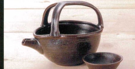
南蛮 土物 331-9-272 手付冷酒器 4,700円 17.5×12.5×12.5cm (500cc) 32122271 331-10-272 口広片口盃 1,200円 8.5×8×3.5cm 32123271