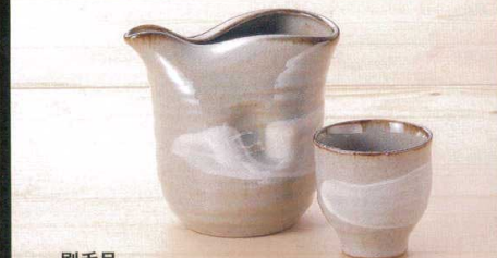
刷毛目 331-3-272 冷酒器 1,900円 11×7×10.3cm (450cc) 32215271 331-4-272 刷毛目カップ 820円 6.9×6.1cm 32216271