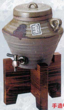
345-6-902 焼酎瓶サーバー 蓋付E壺木台付 (常滑焼) 33,000円 21×33cm (2300cc) 6入 中蓋コルク付 33506901