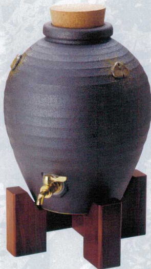
345-2-202 伊賀吹5号サーバー 35,000円 28×36cm (9000cc) 33502201