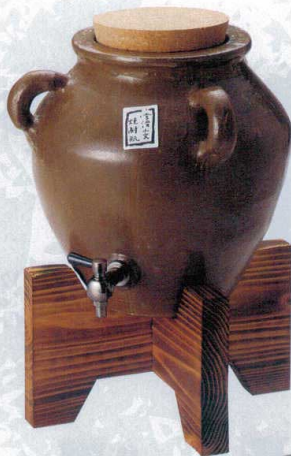
345-1-902 焼酎サーバー 瓶釉5ℓ木台付 (SH16) (常滑焼) 35,000円 5620cc (台付40cm・本体27cm) 2入 33501901