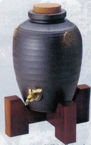
345-10-202 伊賀吹3号サーバー 23,500円 22×29cm (5400cc) 33510201