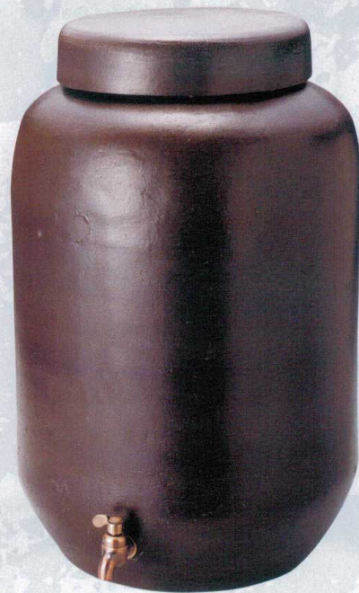
345-5-902 甕サーバー(水・焼酎用) 40ℓ茶瓶釉(常滑焼) 130,000円 36×61cm (40000cc) 1入 33505901