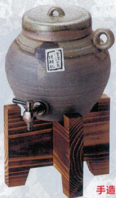
345-7-902 焼酎瓶サーバー 蓋付D壺木台付 (常滑焼) 33,000円 20×33cm (2300cc) 6入 中蓋コルク付 33507901