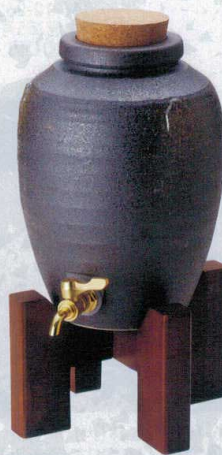
345-8-202 伊賀吹2号サーバー 17,000円 20×26cm (3600cc) 1入 33508201