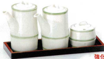
368-5-702 クリームライン汁次(中) 1,280円 6.2×9.5×11cm(220cc) 36805702