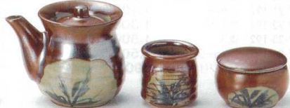
368-33-052 赤絵山水辛子入 1,800円 5.7×4cm 36833052