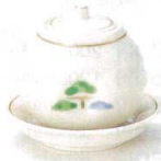
368-40-052 松丸台付汁次 2,600円 8×7.5cm(165cc) 36840052