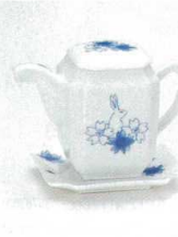
368-46-052 染付うさぎ桜角汁次 2,350円 11.2×5.8×8cm(170cc) 36846052