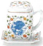
368-31-052 赤絵山水台付汁次 3,400円 11×8.8×8cm(170cc) 36831052