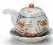
368-28-012 手描花鳥汁次台付 3,400円 8×8cm(160cc) 35838011