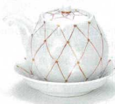
368-37-192 赤アミヘコ汁次皿付 2,300円 180cc 10×10入 35731191