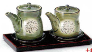
368-8-782 織部菊汁次(大)皿付 1,500円 7.7×9.7cm(200cc) 5入 36808782