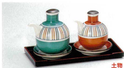
368-1-782 クレーン十草汁次(大)皿付 2,100円 7.8×10.2cm(210cc) 5入 35806781