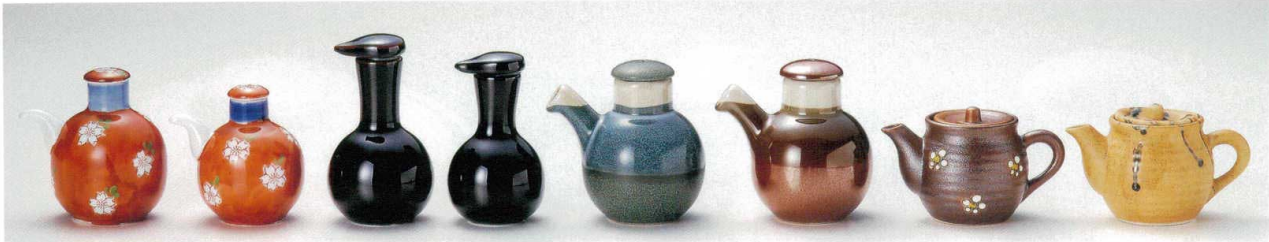
369-1-712 赤濃花汁次(大) 2,150円 10×10cm(210cc) 35817711 369-2-712 赤濃花汁次(小) 2,000円 9×9cm(150cc) 35816711 369-3-712 天目汁次(大) 1,100円 6.5×13cm(170cc) 35902711 369-4-712 天目汁次(小) 1,100円 6×11.7cm(130cc) 35901711 369-5-512 塗り分け(青)汁次 650円 8.5×10.8cm(270cc) 8入 36905512 369-6-512 塗り分け(赤)汁次 650円 8.5×10.8cm(270cc) 8入 36906512 369-7-712 南蛮白梅汁次 800円 7×8cm(185cc) 35915711 369-8-712 織部流し汁次 800円 7×8cm(185cc) 35914711