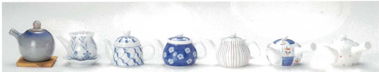
369-16-162 青吹焼杉台付汁次 1,950円 8×10cm(220cc) 35918161 369-17-712 花だより汁次 1,050円 7×7.5cm(120cc) 35907711 369-18-712 花だより受皿 300円 9×2.5cm 35908711 369-19-652 網目汁次(中国製) 480円 7.5×8cm(140cc) 1入 35916651 369-20-522 濃梅ボット型汁次(中国製) 700円 200cc 36920522 369-21-522 京十草ボット型汁次(中国製) 800円 200cc 36921522 369-22-652 市松小花ミニ急須(かご網付)(中国製) 800円 200cc 1入 36922652 369-23-652 水玉ミニ急須(かご網付)(中国製) 700円 200cc 1入 36923652