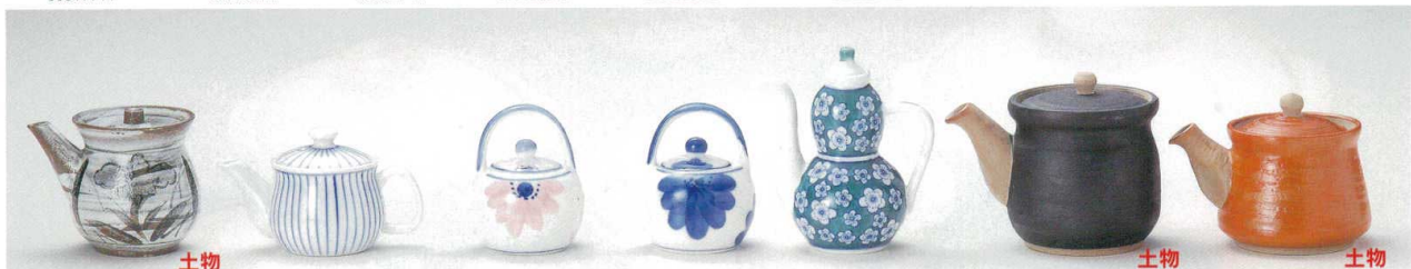
369-9-522 南蛮間取花タマリ差し 1,280円 10.5×8.2×8.3cm(270cc) 35906521 369-10-652 十草汁次(中国製) 480円 7×7.5cm(140cc) 1入 35917651 369-11-302 赤菊汁次 430円 7×8.5cm(150cc) 35821301 369-12-302 青菊汁次 430円 7×8.5cm(150cc) 35820301 369-13-302 濃梅汁次 480円 8×13cm(200cc) 35815301 369-14-782 黒塗ダシ入(大) 2,700円 13.1×9.3×11cm(450cc) 36914782 369-15-782 朱塗ダシ入(小) 2,600円 12×9.8×9.5cm(280cc) 36915782