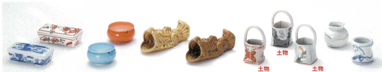
369-24-192 山水蓋付楊子 1,300円 10×5.4×3.5cm 35941191 369-25-192 花鳥蓋付楊子 2,050円 10×5.4×3.5cm 35940191 369-26-192 トルコ平カラシ 1,000円 35943191 369-27-192 オレンジ平カラシ 1,000円 35942191 369-28-052 おこぜ黄串入(大) 650円 13.5×5.5×6.1cm 35939051 369-29-052 おこぜ茶串入(大) 650円 13.5×5.5×6.1cm 35938051 369-30-202 赤蝶楊枝入 1,500円 8.8×5.4cm 35849201 369-31-202 山茶花楊枝入 1,500円 8.8×5.4cm 35848201 369-32-202 白梅楊枝入 1,500円 8.8×5.4cm 35847201 369-33-202 銀彩楊枝 1,250円 4.2×5.5cm 35828201 369-34-202 磁部花紋玉楊枝入 940円 5.1×5.3cm 35913201