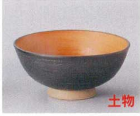
463-5-712 黒塗内朱中平 860円 11.4×5.3cm 44926711