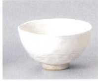
463-15-212 粉引筋茶碗 780円 11×6.3cm 45010211