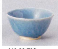
463-28-712 彩り(コス)飯碗 600円 11.7×6cm 45042711