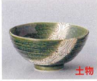
463-4-032 織部七宝手びねり茶碗 1,050円 12.5×6cm 46304032