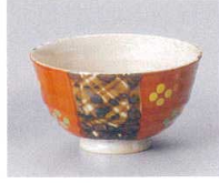
463-20-262 赤絵間取飯碗(小) 740円 11.5×5.5cm 10×12入 45006261