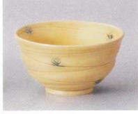
463-17-712 黄瀬戸草紋飯碗 760円 10.5×6.5cm 46317712