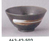
463-42-502 白刷毛天目茶碗 280円 12×6cm 45136501