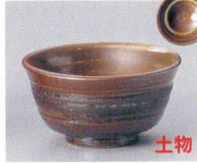
463-14-212 錆白刷毛茶碗 780円 11.5×6cm 44937211