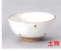
463-22-212 白釉水玉茶碗 700円 11×5.5cm 45013211