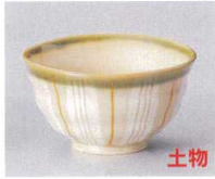
463-10-782 澗刈ハトクサ飯碗 840円 11.4×6.2cm 44932781