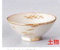
463-26-732 乾山風芦絵中平 620円 12.2×5.2cm 46326732