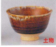
463-18-012 アメ澗ウフ中平 750円 11.8×7.4cm 46318012