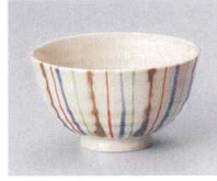
463-19-262 赤絵十草飯碗(小) 740円 11.5×5.5cm 10×12入 45005261