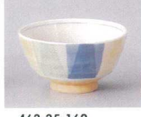
463-35-162 色紙中平(青) 540円 11.2×6cm 46335162