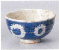
463-2-262 丸紋飯碗 950円 11.7×6.3cm 10×12入 44924261