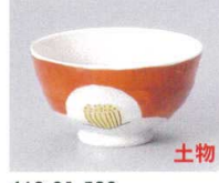
463-31-522 椿茶碗 580円 11.2×6cm 46331522