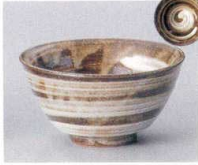
463-3-352 南蛮渦中平 900円 12.3×6.3cm 44922351