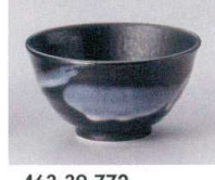
463-39-772 朝霞 黒飯碗 360円 12.1×6.5cm 46339772