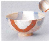
463-7-702 赤絵志野陽炎中平 850円 11.5×5.4cm 44935701