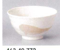
463-40-772 朝霞 白飯碗 360円 12.1×6.5cm 46340772