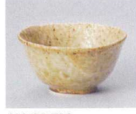
463-25-712 黄唐津飯碗 630円 11.8×6.3cm 45030711