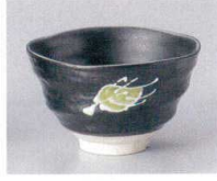
463-21-282 黒釉木の葉中平 700円 10.7×6.7cm 100入 45019281