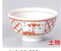
463-32-522 格子間取花茶碗 580円 11.2×6cm 46332522