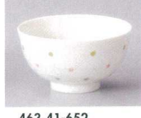
463-41-652 水玉飯碗 300円 11×5.8cm 46341652