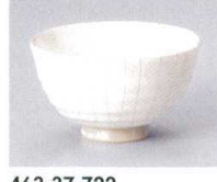
463-37-722 粉引十草茶碗 530円 11.2×6.3cm 45033721