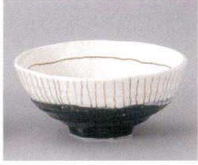
463-6-502 ストライプ飯碗 850円 12.5×5.5cm 44929501