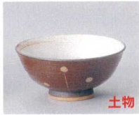
463-9-712 玉十草中平 850円 10.4×5.3cm 46309712