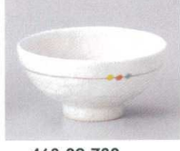
463-29-732 水玉大平 600円 12×6cm 45027731