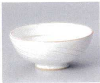
463-1-192 粉引三島中平 980円 12.2×5.3cm 46301192