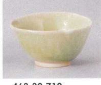
463-30-712 彩り(グリーン)飯碗 600円 11.7×6cm 45041711