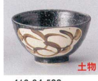
463-34-522 黒釉草紋茶碗 550円 12×6.5cm 45026521