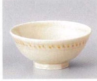
463-16-732 おとずれ中平 770円 12×5.5cm 45009731