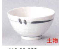
463-33-522 せせらぎ茶碗 550円 12×6.5cm 45032521