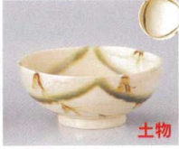
463-12-712 草紋織部中平 840円 11.7×5cm 44931711