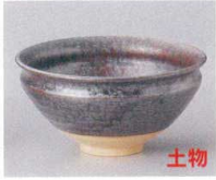
463-11-352 錆油滴飯碗 840円 12.8×6.3cm 08017351