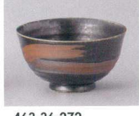
463-36-272 いぶし天目飯碗 530円 11.2×6.4cm 43514271