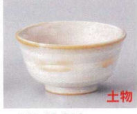
463-23-212 粉引刷毛反茶碗 670円 12×6.5cm 45014211