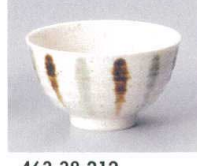
463-38-212 二色十草茶碗 390円 11.3×6.5cm 45116211