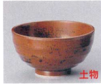
463-13-212 錆茶碗 820円 12×6.5cm 44941211