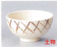
463-8-212 志野錆格子茶碗 850円 12×6.5cm 46308212