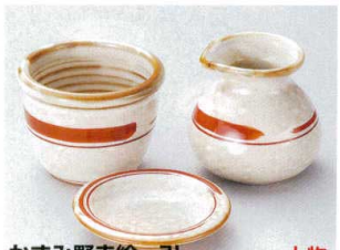
かすみ野赤絵一引

474-25-372 そば徳利 850円 8×8cm(180cc) 45949371 474-26-372 そば千代口 710円 9×6.5cm 45950371 474-27-372 やくみ皿 430円 9.5×1.6cm 45951371