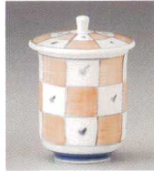
497-11-672 市松ピンク蓋付湯呑 1,150円 7x11cm(210cc) 10入 48514671