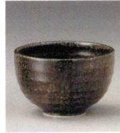
497-42-672 窯変織部いっぷく碗 360円 10.5x6.5cm(300cc) 43237671