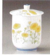
497-7-262 カモミール蓋付湯呑(大) 920円 6.5x10.5cm(200cc) 10入 48517261