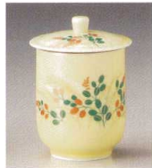
497-17-512 秋草蓋付組湯呑(大) 850円 6.6x10.5cm(230cc) 10入 48519511