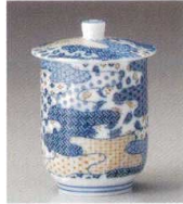
497-12-262 友禅蓋付湯呑(大) 1,000円 6.5x10.5cm(200cc) 10入 48515261