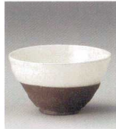
497-31-202 黒陶塗分汲出 1,100円 11.2x6.5cm(290cc) 49506201