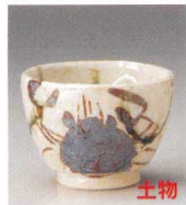
497-22-202 織部カニ文汲出 2,250円 10.1x7.6cm(300cc) 48532201