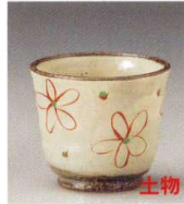
497-21-012 黄化粧花散洩反湯呑 2,000円 8.7x7.4cm(225cc) 49721012