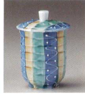
497-6-262 エスニック蓋付湯呑(大) 1,200円 6.5x8.5cm(190cc) 5入 48509261