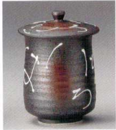
497-2-512 備前風いろは蓋付寿司湯呑 1,400円 7.8x12.3cm(340cc) 8入 49702512