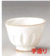
497-30-682 粉引彫干茶 1,130円 9.2x6.2cm(170cc) 49606681