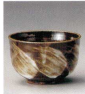
497-40-352 益子荒刷毛たつぷり碗 680円 10.1x6.5cm(250cc) 49740352