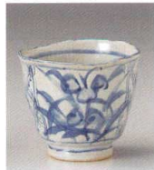
497-24-552 藍染間取花たつぷり碗 1,340円 9.3x9.6cm(240cc) 10入 48538551