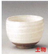
497-37-212 白粉引玉干茶 760円 8.6x7cm(230cc) 20入 49517211