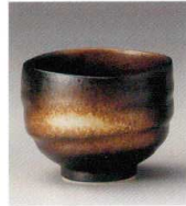
497-41-512 黒備前吹きたつぷり碗 450円 10x7.8cm(350cc) 43523511