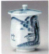
497-1-512 山水蓋付寿司湯呑 1,400円 7.7x12.5cm(340cc) 8入 49701512