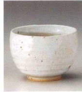
497-34-202 白化粧湯ったり碗 820円 9.6x7.3cm(320cc) 49734202