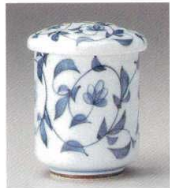
497-8-192 唐草大型蓋付湯呑(大) 1,350円 7.5x10.8cm(300cc) 60入 48511191