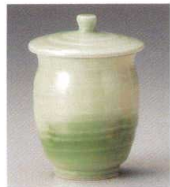
497-15-512 ヒワ蓋付中寿司 1,000円 7.5x11.2cm(230cc) 10入 48521511