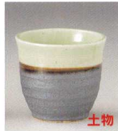
497-39-722 ヒワゆり分け反湯呑 710円 8.3x7.5cm(210cc) 10入 49120721