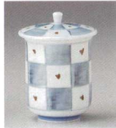
497-10-672 市松グレー蓋付湯呑 1,150円 7x11cm(210cc) 10入 48513671