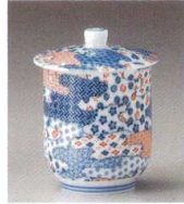
497-13-262 友禅蓋付湯呑(小) 1,000円 6.5x10cm(180cc) 10入 48516261