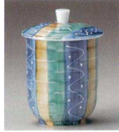
497-5-262 エスニック蓋付寿司湯呑 1,300円 7.2x9cm(200cc) 5入 48508261