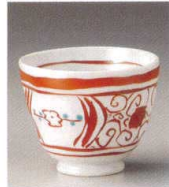
497-27-202 赤絵万歴ゆとり碗 1,200円 9.9x7.7cm(250cc) 49727202