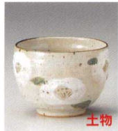
497-36-012 椿ゆったり碗(湯呑) 800円 9.2x7cm(320cc) 10入 49736012