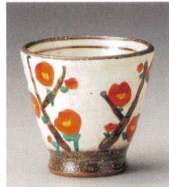
497-19-012 黄化粧梅反湯呑 2,000円 8.7x7.4cm(225cc) 49719012