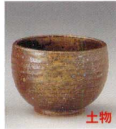
497-32-512 備前ゆったり碗 900円 10.1x7.4cm(350cc) 43428511