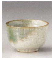
497-38-352 カイヤギ織部たつぷり碗 750円 10.1x6.5cm(250cc) 43501351