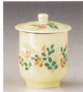
497-18-512 秋草蓋付組湯呑(小) 850円 6.5x10cm(200cc) 10入 48520511