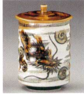
497-4-262 アメ童蓋付寿司湯呑 1,250円 8.3x13cm(330cc) 5入 48505261