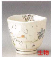
497-23-212 あかさたな湯呑 1,400円 9.3x8cm(245cc) 10入 48537211