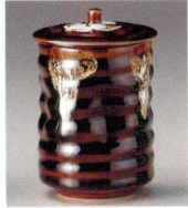
497-3-262 天目流蓋付寿司湯呑 1,250円 8.3x13cm(330cc) 5入 48501261