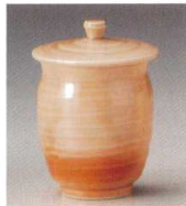
497-16-512 ピンク蓋付中寿司 1,000円 7.5x11.2cm(230cc) 10入 48528511