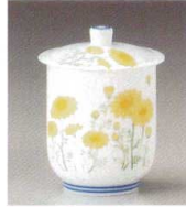
497-14-262 カモミール蓋付湯呑(小) 920円 6.5x10cm(180cc) 10入 48518261