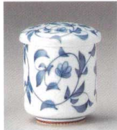
497-9-192 唐草大型蓋付湯呑(小) 1,250円 7.5x9.8cm(280cc) 60入 48512191