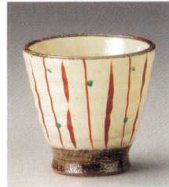
497-20-012 黄化粧十草反湯呑 2,000円 8.7x7.4cm(225cc) 49720012