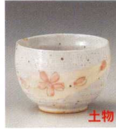
497-35-012 花舞ゆったり碗(湯呑) 800円 9.2x7cm(320cc) 10入 49735012