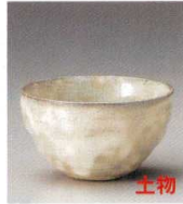
497-33-202 白流粉引丸煎茶 850円 10x5.8cm(220cc) 49507201