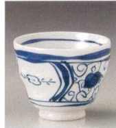
497-28-202 染付万歴ゆとり碗 1,000円 9.9x7.7cm(250cc) 49728202