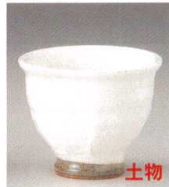
497-25-212 粉引彫入高台湯呑 1,300円 9.5x7.8cm(220cc) 10入 48539211