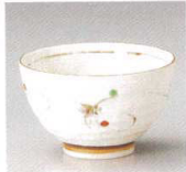
509-2-372 粉引赤絵唐草干茶 500円 9.1×5.5cm(170cc) 49735371