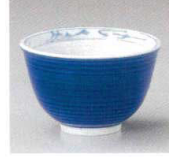
509-26-632 コス巻ぶどう干茶 370円 9×5.7cm(190cc) 50926632