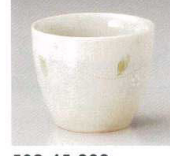
509-45-202 ラズベリー干茶 550円 7.5×6.4cm(150cc) 50945202