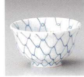
509-20-712 内外網厚口煎茶 400円 9.5×5.3cm(200cc) 50920712