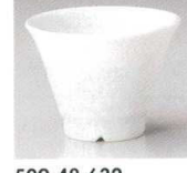
509-48-632 白EL干茶 360円 9.2×6.8cm(190cc) 50948632