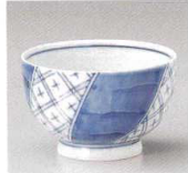
509-3-522 祥瑞高浜干茶(中国製) 480円 8.8×6.3cm(190cc) 50903522