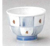
509-11-672 市松グレー干茶 430円 8×6cm(150cc) 49934671