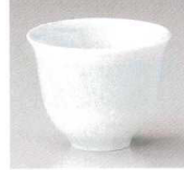
509-19-372 青白磁つゆ草反煎茶 400円 7.6×6cm(120cc) 49940371