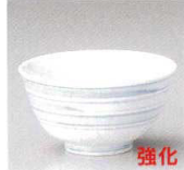
509-4-782 駒筋反干茶 460円 9.3×5cm(150cc) 50904782