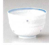
509-38-632 梅影反干茶 310円 8.4×5.5cm(170cc) 49746631