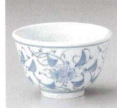
509-16-672 花唐草干茶(厚口) 420円 9×5.5cm(180cc) 49830671