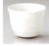
509-33-212 白雪反干茶 350円 8.1×6.3cm(155cc) 50933212