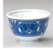
509-29-282 花紋煎茶 360円 9×5.6cm(200cc) 120入 50929282