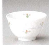
509-15-712 小花反干茶 420円 8.5×5cm(150cc) 49925711