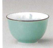
509-10-512 ヒスイカサブランカ小反干茶 450円 7.8×4.9cm(130cc) 20入 49937511