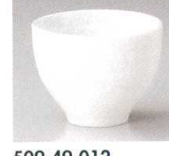
509-49-012 白小干茶 230円 7.8×6cm(155cc) 50949012