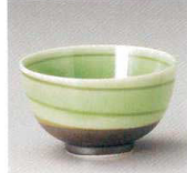
509-9-712 緑彩京干茶 450円 9.2×5.5cm(200cc) 49737711