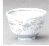
509-25-282 なつな厚口反煎茶 370円 9×5.8cm(200cc) 120入 50925282