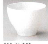
509-46-252 白磁干茶 460円 9×6.5cm(190cc) 50946252