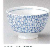
509-42-372 京桜干茶 250円 9.1×5.5cm(170cc) 49749371