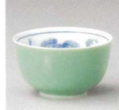
509-12-282 外グリーンブドウ煎茶 430円 8.7×4.7cm(150cc) 120入 50912282