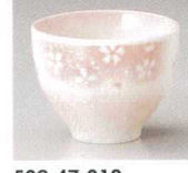
509-47-012 桜小干茶 380円 7.8×6cm(155cc) 50947012