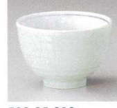
509-35-212 ヒフトリ干茶 330円 8.5×5.5cm(160cc) 49745211