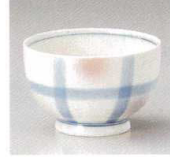
509-24-302 格子干茶 380円 8.5×5.5cm(170cc) 49521301