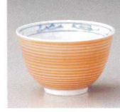
509-28-632 朱巻ぶどう干茶 370円 9×5.7cm(190cc) 50928632