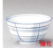
509-6-712 格子反干茶 460円 9.3×4.8cm(200cc) 49815711