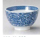
509-41-282 タコ唐草煎茶 260円 9.1×5.6cm(190cc) 150入 50941282