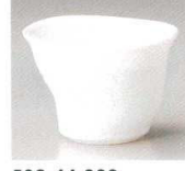
509-44-282 ニューボンフリーカップ 650円 190cc 50944282