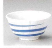
509-39-722 うず厚口反干茶 310円 9.8×5cm(180cc) 50939722