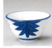
509-36-722 厚口大輪菊反干茶 330円 9.8×5cm(180cc) 49838721