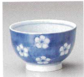
509-1-302 ダミ梅干茶 500円 8.5×5.5cm(170cc) 49519301