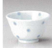
509-13-212 水玉厚口反干茶 430円 9.3×5.5cm(170cc) 49822211