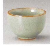
509-31-282 口サビ貫入煎茶 350円 8×5.5cm(150cc) 120入 50931282