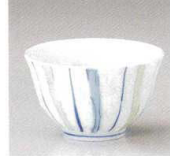
509-17-712 竹十草反干茶 420円 8.5×5cm(170cc) 49741711