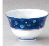
509-14-712 帯木の葉反干茶 430円 9.6×5.5cm(180cc) 49821711