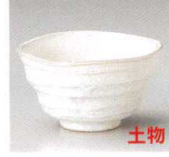
509-30-052 白結晶六兵衛干茶 360円 9.2×5.2cm(170cc) 49646051