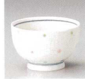
509-18-652 水玉煎茶(中国製) 400円 8.5×5.5cm(170cc) 5入 50918652