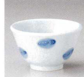
509-7-282 一珍渦煎茶 450円 9.5×5.5cm(200cc) 120入 49819281