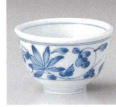
509-21-632 鉄仙厚口干茶 390円 9×5.8cm(170cc) 120入 49832631