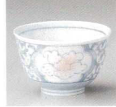
509-23-282 吹花反煎茶 380円 9×5.8cm(200cc) 120入 50923282