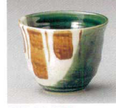
509-32-212 織部十草反湯呑 350円 8×6.5cm(156cc) 20入 50932212