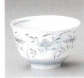
509-22-672 なすな干茶 390円 9×5.5cm(180cc) 49742671