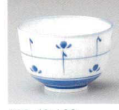
509-40-632 新芽干茶 300円 8.5×5.5cm(170cc) 120入 49927631