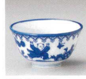
509-37-722 厚口唐子反干茶 300円 9.8×5cm(180cc) 49848721