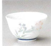
509-8-712 ナデシコ反干茶 450円 8.5×5cm(180cc) 49918711