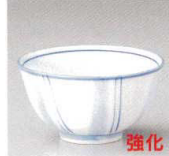
509-5-782 親子十草反干茶 460円 9.4×5cm(150cc) 49816781