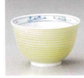
509-27-632 ヒワ巻ぶどう干茶 370円 9×5.7cm(190cc) 50927632