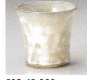
509-43-202 粉引白流手なしコーヒー 850円 8.5×8cm(230cc) 50943202