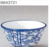
510-47-782 竹林厚口反干茶 300円 9×5.5cm(180cc) 49847781