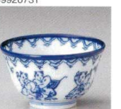
510-27-712 内外唐子反干茶 450円 9.5×5.6cm(170cc) 49833711