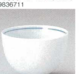
510-49-252 青白磁小干茶 300円 8.3×5.8cm(160cc) 49928251