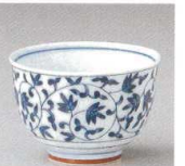
510-19-732 唐草反干茶 520円 8.5×5.5cm(160cc) 49732731