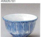
510-37-712 刷毛目厚口反干茶 340円 9.8×5.3cm(200cc) 49835711