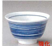
510-15-712 コス刷毛反干茶 600円 9.8×5.6cm(160cc) 49810711