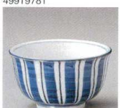
510-30-782 親子十草2.8反干茶 420円 9.4×5.3cm(140cc) 49926781