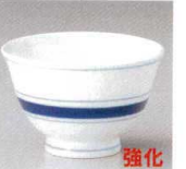
510-14-202 呉須ライン反干茶 630円 9×5.7cm(170cc) 49811201