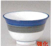
510-17-702 二色ライン反干茶 520円 9.2×5.5cm(120cc) 49812701