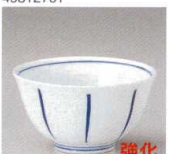
510-24-722 十草反干茶 460円 9.4×5cm(180cc) 49924721