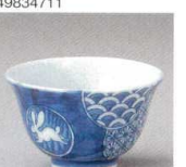
510-33-712 京祥瑞反干茶 400円 9.2×5.5cm(180cc) 49825711