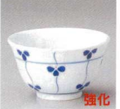
510-11-732 三つ葉反干茶 760円 9×5cm(160cc) 49904731