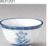
510-35-712 桔梗厚口干茶 400円 9.7×5.5cm(150cc) 49826711