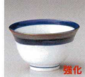
510-8-792 二色筋反干茶 820円 9.2×5.5cm(180cc) 49807791