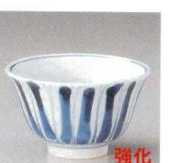
510-7-732 立筋反干茶 860円 9.3×5.5cm(160cc) 49803731