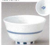
510-23-782 見込梅厚口干茶 460円 9.2×5.2cm(150cc) 49919781