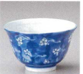
510-18-712 ダミ花唐草反干茶 520円 9.4×5.6cm(180cc) 49817711