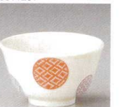
510-21-722 丸紋厚口反干茶 490円 9.1×5.3cm(160cc) 49733721