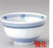
510-13-722 湖水水玉反干茶 620円 9.4×5cm(180cc) 49726721