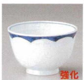
510-3-052 染付花紋干茶 980円 9.2×6cm(200cc) 51003052