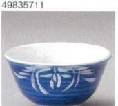
510-44-712 呉須巻蘭反干茶(厚口) 320円 9.7×5.2cm(200cc) 49845711