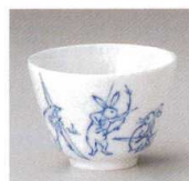
510-1-052 高山寺うさぎ干茶 1,400円 8.7×6.3cm(160cc) 51001052