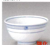
510-22-792 ダミライン干茶 470円 9.4×5cm(160cc) 49814791