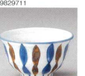
510-41-712 二色点十草厚口煎茶 340円 9.5×5.3cm(200cc) 51041712