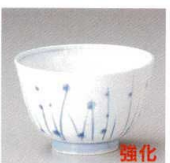
510-4-052 染付珠玉干茶 980円 9.2×6cm(200cc) 51004052