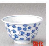
510-6-732 なづな反干茶 860円 9.3×5.5cm(160cc) 49802731