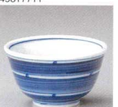
510-25-782 ライン水玉厚口反干茶 460円 9.2×5.2cm(150cc) 49922781