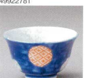
510-32-712 丸紋祥瑞反干茶 450円 9.7×5.4cm(180cc) 49818711