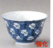
510-12-702 梅づくし反干茶 750円 9.3×5.5cm(120cc) 49806701