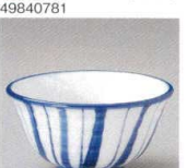
510-45-722 太十草反干茶 320円 9.8×5cm(180cc) 49844721