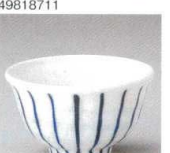
510-39-712 コス十草反干茶(厚口) 340円 9.7×5.4cm(200cc) 49839711