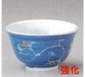
510-10-732 呉須巻葡萄反干茶 760円 9×5cm(160cc) 49901731