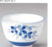
510-28-202 巻ハギ反干茶(厚口) 450円 8.9×5.8cm(170cc) 49831201