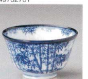
510-26-712 内外竹林反干茶 450円 9.5×5.6cm(170cc) 49834711