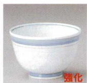
510-2-052 染付格筋干茶 980円 9.2×6cm(200cc) 51002052