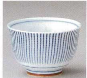
510-16-192 十草2.8反干茶 550円 8.5×5.7cm(160cc) 49919191