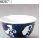
510-42-712 雪月花反干茶(厚口) 340円 9.3×5.1cm(200cc) 49836711