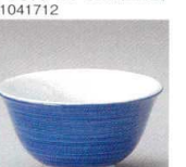
510-48-722 厚口刷毛目反干茶 300円 9.8×5cm(180cc) 49849721