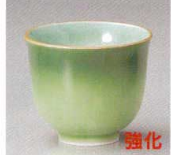
510-9-712 緑彩反干茶(小) 780円 7.3×6.2cm(160cc) 49935711