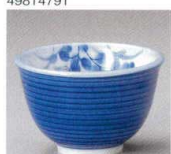
510-29-202 呉須巻小萩反干茶(厚口) 450円 8.9×5.8cm(170cc) 49828201