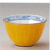
510-5-782 黄釉面取草花紋反干茶 880円 8.8×5.5cm(150cc) 51005782