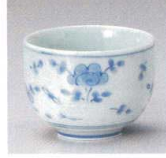
511-15-922 花の舞千茶(有田焼) 350円 7.7×6cm(110cc) 10入 50242921