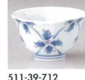
511-39-712 千両反千茶 400円 9.3×5.5cm(180cc) 49824711