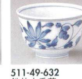
511-49-632 鉄仙小千茶 300円 7.2×5cm(130cc) 49942631