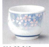
511-22-262 舞花玉湯呑 260円 7.4×6cm(170cc) 10入 49547261