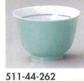
511-44-262 ヒスイ内絵山茶花反千茶(小) 460円 7.5×5cm(110cc) 20入 49941261