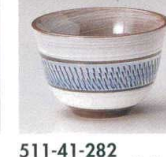
511-41-282 プレートチリ反煎茶 330円 8.2×5.5cm(140cc) 150入 51141282