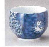
511-13-712 京祥瑞玉湯呑 400円 8×6cm(200cc) 49532711