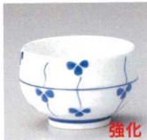
511-1-732 三つ葉玉千茶 1,000円 7.7×5.3cm(150cc) 49515731