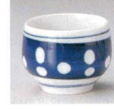
511-19-262 ルリ水玉玉湯呑 290円 7.3×6cm(170cc) 10入 49540261