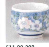
511-28-302 山茶花玉湯呑 240円 7.5×5.8cm(160cc) 49544301