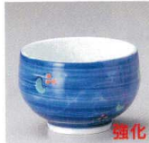
511-2-732 呉須巻葡萄千茶 1,000円 7.7×5.3cm(150cc) 49516731