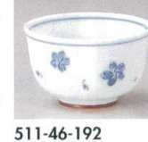
511-46-192 小花2.4煎茶 430円 7.6×4.5cm(90cc) 49947191