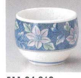
511-24-262 布目鉄仙玉湯呑 260円 7.3×6cm(180cc) 10入 49548261