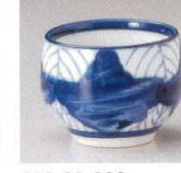
511-21-302 木の葉玉湯呑 260円 7.5×5.8cm(160cc) 49539301