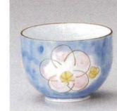
511-5-922 梅園つぼ千茶(有田焼) 500円 7.5×5.7cm(100cc) 10入 51105922