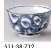
511-38-712 水泡腰丸千茶 430円 9×5cm(150cc) 49923711