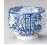
511-12-712 竹林玉湯呑 420円 8.2×6.1cm(180cc) 49537711