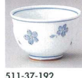
511-37-192 小花2.8反千茶 560円 8.5×5.6cm(160cc) 49913191