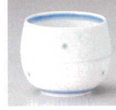
511-17-632 梅影玉湯呑 320円 7×6.3cm(200cc) 49747631