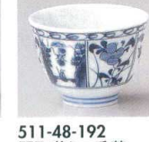
511-48-192 間取花ミニ千茶 380円 6.3×4.7cm(80cc) 49949191