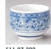
511-27-302 花鳥玉湯呑 240円 7.5×5.8cm(160cc) 49545301