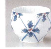
511-14-712 千両玉湯呑 400円 8×6cm(200cc) 49533711