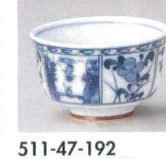
511-47-192 間取花2.4千茶 430円 7.6×4.5cm(90cc) 200入 49948191