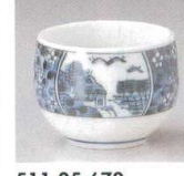
511-25-672 山水玉湯呑 250円 7.4×6cm(170cc) 10入 49546671