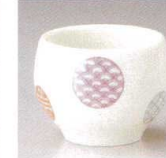
511-7-712 源氏丸紋玉湯呑 480円 8.3×6.4cm(200cc) 49530711