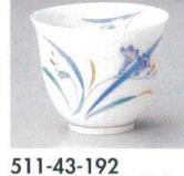
511-43-192 フリージア深口煎茶 500円 7.9×5.9cm(130cc) 49932191