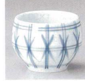
511-10-712 江戸格子玉湯呑 450円 8×6cm(200cc) 49531711