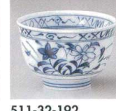
511-32-192 内外桔梗2.8反千茶 650円 8.5×5.6cm(160cc) 49910191