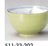
511-33-202 草花千茶(ヒワ) 690円 8.2×5.2cm(180cc) 49528201