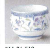
511-26-512 花園玉湯呑 250円 7.3×6cm(190cc) 20入 51126512