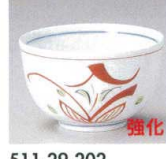
511-29-202 手描き京小花反千茶 1,100円 8.7×5.5cm(170cc) 51129202