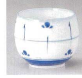
511-18-632 新芽玉湯呑 310円 7×6.3cm(200cc) 120入 49538631