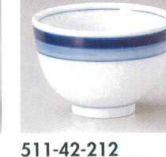
511-42-212 呉須線丸型千茶 330円 8.6×5.7cm(160cc) 49748211