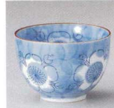
511-3-922 内外梅千茶(有田焼) 550円 8.2×5.8cm(120cc) 10入 51103922