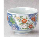
511-6-692 花流水仙茶(有田焼) 500円 8×6cm(150cc) 10×16入 50240691