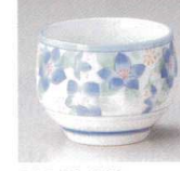
511-20-262 よろこび玉湯呑 280円 7.8×6cm(160cc) 10入 49543261