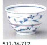
511-36-712 段唐草反千茶 590円 8.8×5.2cm(160cc) 49912711