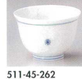
511-45-262 梅影反千茶 460円 7.5×5cm(110cc) 20入 49921261