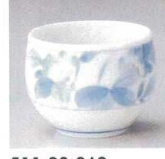
511-23-262 花情玉湯呑 260円 7.3×6.2cm(180cc) 10入 49549261