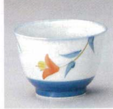
511-8-922 コス巻芦絵千茶(有田焼) 460円 8×6cm(120cc) 10入 51108922