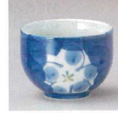
511-11-922 大梅千茶(有田焼) 450円 7.5×5.6cm(100cc) 10入 50239921