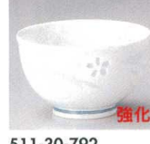
511-30-792 ホタルナデンコ千茶 920円 8.9×5.3cm(180cc) 49713791