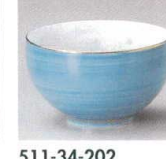
511-34-202 桜千茶(ブルー) 690円 8.2×5.2cm(180cc) 49527201