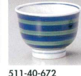
511-40-672 二色ライン千茶 400円 8×6cm(150cc) 49933671