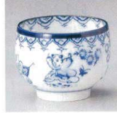
511-9-712 唐子玉湯呑 450円 8.2×6.1cm(180cc) 49536711