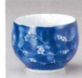
511-4-712 ダミ花唐草玉湯呑 540円 8×6cm(200cc) 49529711