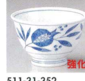
511-31-352 ザクロ反千茶 690円 8.7×5.7cm(150cc) 49809351