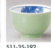
511-35-192 内ブドーヒワ巻千茶 640円 8.5×5.5cm(160cc) 49911191