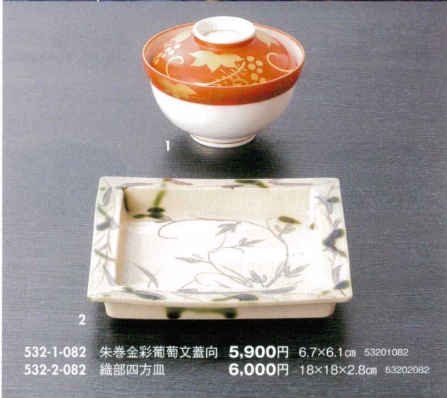
532-1-082 朱巻金彩葡萄文蓋向 5,900円 6.7×6.1cm 53201082 532-2-082 織部四方皿 6,000円 18×18×2.8cm 53202082