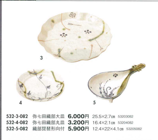
532-3-082 弥七田織部大皿 6,000円 25.5×2.7cm 53203082 532-4-082 弥七田織部丸皿 3,200円 16.4×2.1cm 53204082 532-5-082 織部琵琶形向付 5,900円 12.4×22×4.1cm 53205082