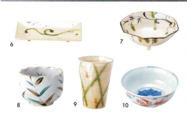
532-6-082 弥七田織部長方皿 3,600円 15.5×9.3×2cm 53206082 532-7-082 織部足付向付 5,600円 16.2×5.9cm 53207082 532-8-082 芦文小鉢 3,300円 10.6×7.8cm 53208082 532-9-082 三彩フリーカップ 3,800円 8×11cm (300cc) 53209082 532-10-082 赤絵花鳥文小鉢 3,500円 14.2×5.7cm 53210082