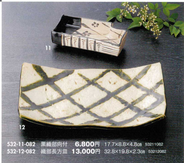
532-11-082 黒織部向付 6,800円 17.7×8.8×4.8cm 53211082 532-12-082 織部長方皿 13,000円 32.8×19.8×2.3cm 53212082