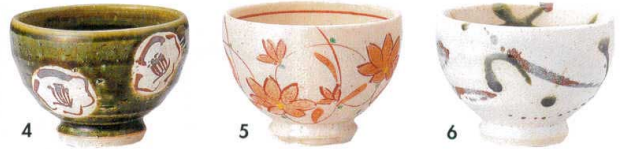
536-4-202 織部椿ゆつたり碗 1,700円 10×7.5cm 52410201 536-5-202 赤絵唐草ゆつたり碗 1,800円 10×7.5cm 52411201 536-6-202 志野織部流ゆつたり碗 1,700円 10×7.5cm 52412201

中国春秋時代の人 老子が「埴を ねて以って器を為るその無々当って器の用あり…故は有の以って利を為すは無の以って用をなせばなり…」無の用! 如何ようにもお使いいただきより一層のご愛顧賜りますようお願い申し上げます。