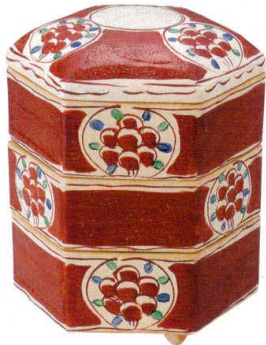
536-1-202 丸紋赤絵三段重(大) 23,500円 20.5×18×24cm 52416201