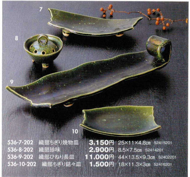
536-7-202 織部ちぎり焼物皿 3,150円 25×11×4.8cm 52415201 536-8-202 織部珍珠 2,900円 8.5×7.5cm 52414201 536-9-202 織部ひねり長皿 11,000円 44×13.5×9.3cm 52402201 536-10-202 織部ちぎり銘々皿 1,500円 18×11.3×3cm 52416201