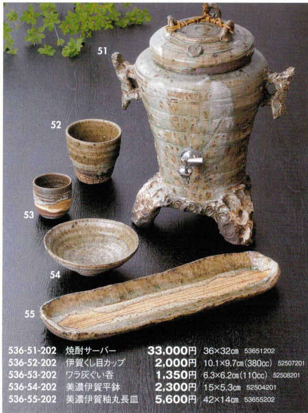
536-51-202 焼耐サーバー 33,000円 36×32cm 53651202 536-52-202 伊賀くし目カップ 2,000円 10.1×9.7cm (380cc) 52507201 536-53-202 ワラ灰ぐい呑 1,350円 6.3×6.2cm (110cc) 52508201 536-54-202 美濃伊賀平鉢 2,300円 15×5.3cm 52504201 536-55-202 美濃伊賀釉丸長皿 5,600円 42×14cm 53655202