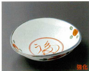
66-5-202 福の字楕円向付 3,100円 16×14.7×4.5cm 04103201