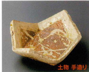
66-2-752 土灰釉折紙型向付 4,800円 15.7×15.7×7cm 06602752