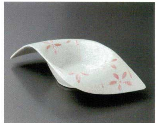
66-8-552 ラスターピンク花変形鉢 2,750円 25×12×5.8cm 20入 06608552