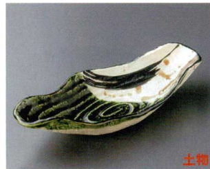
66-21-162 織部錆刷毛目舟形向付 2,300円 26×11×4.5cm 05803161