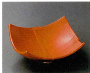
66-14-552 セレン赤4.5寸中皿 2,400円 13.8×5.7cm 60入 06606551 66-15-552 セレン赤3.5寸小鉢 1,820円 13.8×5.7cm 80入 06605551