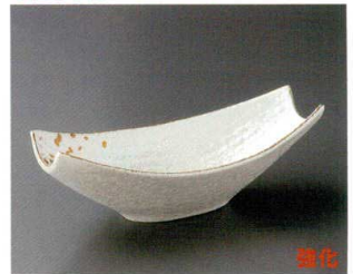
66-22-792 金吹雪小鉢 2,280円 17.3×8.1×5.5cm 06607791