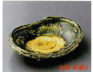
66-4-252 手造り織部楕円向付 3,800円 17×13×5cm 06604252