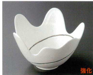
66-7-552 NBシルバーライントルネード深鉢 2,800円 17.3×15.5×10.8cm 30入 05412551