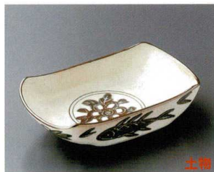
66-13-162 粉引魚紋両切向付 2,500円 15.3×9.3×4.2cm 06608161