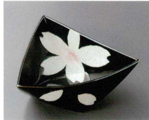
66-3-692 花美人ダイヤ鉢(有田焼) 3,800円 16.5×17.5×7cm 5入 06603692