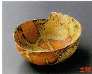
66-10-212 信楽風切込小鉢 2,600円 15×13×6.5cm 06610212