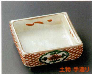
66-1-252 赤絵間取花13cm角鉢 5,500円 13×13×5cm 06601252