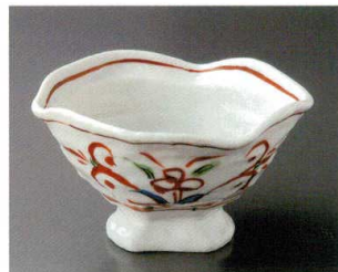
66-16-272 赤絵万暦変型高台鉢 2,400円 14.5×13.5×8cm 07205271