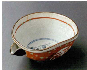
66-6-202 外赤巻福祿寿片口向付 3,100円 17×14.2×7cm 06601201