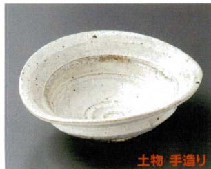
66-19-252 粉引ひねり5.5鉢 2,300円 18.6×16.9×6cm 06619252