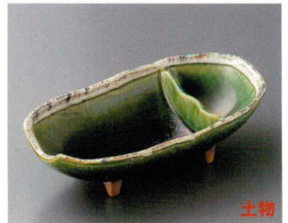
66-12-712 瀏志野織部仕切鉢(中) 2,500円 19×10.1×5.4cm 06604711