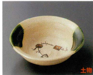
66-11-112 洗入織部たわみ平鉢 2,600円 16.5×16.5×5.5cm 05801111