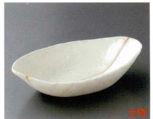
66-17-552 粉引楕円鉢(大) 2,350円 24.2×11.6×5.5cm 04129551 66-18-552 粉引楕円鉢(小) 1,290円 12×6.5×3cm 04130551