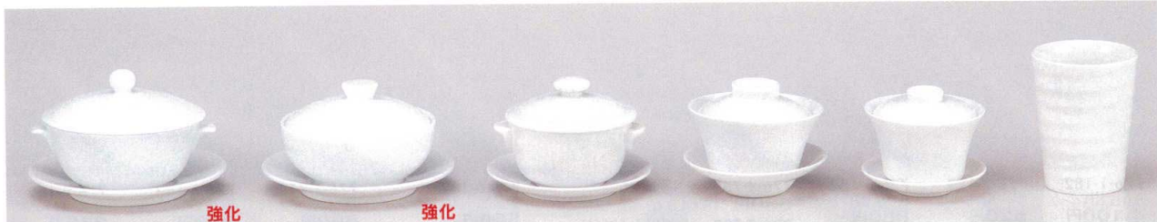
強化 775-1-182 手付フカヒレスープ碗皿 1,950円 14×11.8×9cm 75501181 強化 775-3-182 手ナシフカヒレ碗皿 1,790円 11.7×7.7cm 75503181 775-5-182 ミニフタ付スープ碗皿 1,900円 11.5×9.5×8.7cm 75505181 775-6-182 茶ペイ(大) 1,290円 11.3×10.2×9cm(200cc) 75508181 775-7-182 茶ペイ(小) 1,190円 9.2×9.5×8cm(180cc) 75509181 775-8-182 焼酎カップ 290円 8×10.5cm(280cc) 75515181