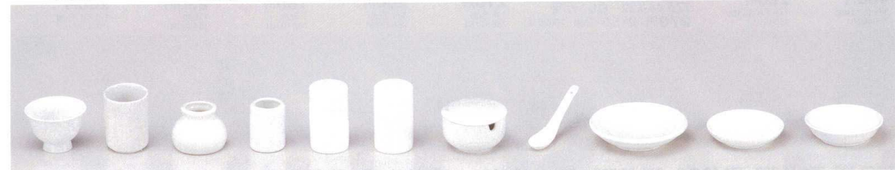
775-31-182 老酒盃 240円 5.8×4cm 75528181 775-32-182 コップ盃 200円 4.3×6cm 75529181 775-33-182 丸楊枝入 300円 3.5×4cm 75530181 775-34-182 切立楊枝入 280円 3.5×4.5cm 75531181 775-35-182 塩入3穴 390円 6.3×3.8cm 75532181 775-36-182 胡椒入5穴 390円 6.3×3.8cm 75533181 775-37-182 カラシ入 390円 6×4.2cm 75534181 775-38-182 ヤクミレンゲ 160円 9.7cm 75535181 775-39-182 玉3.0皿 150円 9.6×2.3cm 77539182 775-40-182 玉2.8皿 140円 9.2×1.9cm 75536181 775-41-182 3吋豆皿 260円 7.5×1.6cm 75538181 775-42-182 3吋ソース皿 260円 7.5×1.8cm 75537181