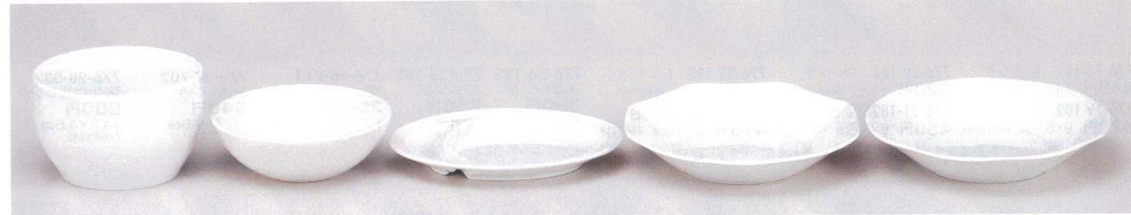
775-15-182 かゆ井(大) 2,150円 14.7×9cm 75431181 775-16-182 かゆ井(小) 1,550円 13×8cm 75430181 775-17-182 6.5ボール 1,180円 19.7×7.4cm 75429181 775-18-182 5.0ボール 750円 15.8×5.2cm 75428181 775-19-182 4.0ボール 500円 12.5×4cm 75427181 775-20-182 8吋ギョウザ皿 1,100円 19.9×15.2×2.7cm 77520182 775-21-182 7.0八角焼飯皿 480円 20.8×3.8cm 77521182 775-22-182 7.0焼飯皿 400円 21.7×4cm 77522182