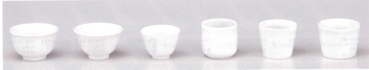
775-9-182 4号反干茶 290円 9.2×5.6cm 75510181 775-10-182 2号反干茶 290円 9.3×5.5cm 75511181 775-11-182 リン干茶 290円 7.5×5.3cm 75512181 775-12-182 2.2湯呑 240円 6.8×6.7cm(150cc) 75514181 775-13-182 杏仁カップ 210円 7.2×6.3cm(140cc) 75516181 775-14-182 ソバ千代口 210円 8.1×5.8cm 75517181