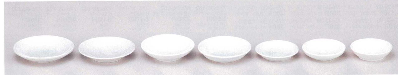
775-23-182 玉4.5取皿 280円 14.2×2cm 75519181 775-24-182 4.5メタ丸皿 260円 13.6×2.5cm 75523181 775-25-182 新型4.0深取皿 350円 12.5×3.1cm 75522181 775-26-182 玉4.5ペリー皿 300円 12.5×2.7cm 75521181 775-27-182 丸3.0皿 210円 10.2×2cm 75526181 775-28-182 深口3.3皿 170円 10×2.8cm 75527181 775-29-182 深口2.8皿 150円 8.6×2.3cm 77529182 775-30-182 3.2深皿 280円 9.7×2.5cm 75524181