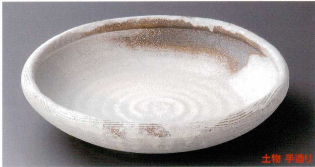
8-1-912 粉引玉漉丸皿(信楽焼) 15,000円 30×6cm 00805911