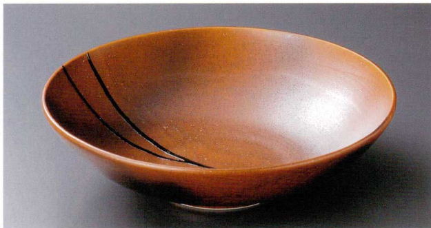
8-3-272 赤伊賀10.0鉢 5,700円 30×7.8cm 01006271