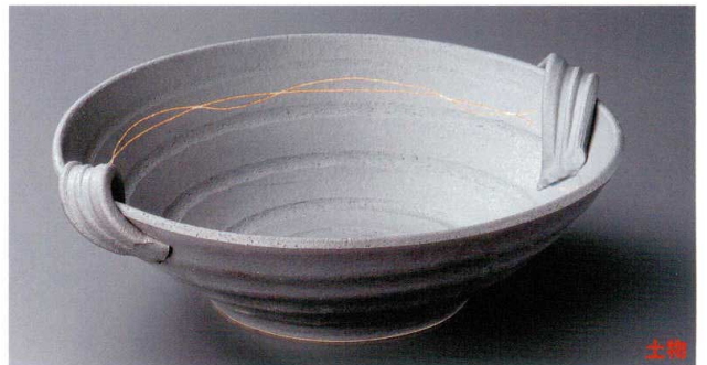
8-8-812 燻し9.0手付盛鉢(萬古焼) 3,600円 31.5×29×9.8cm 17105811