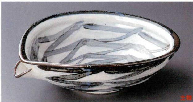
8-7-532 さざなみ片口9.0平鉢 4,200円 30×26.6×8.8cm 01106531