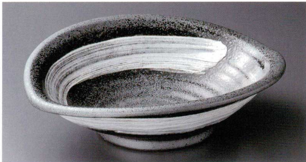
8-5-012 黒釉白刷毛たわみ大鉢 4,400円 33×30×9cm 00805012