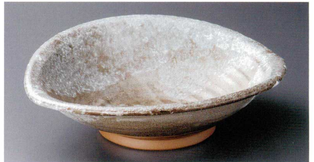
8-6-282 唐津白タタキ盛り鉢 4,350円 33.7×30.5×9.5cm 15入 00806282