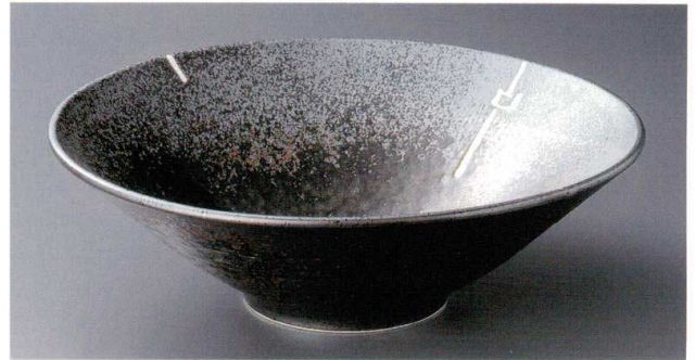
8-2-532 深海白ライン10.0反井 5,800円 30.5×9.5cm 00802532