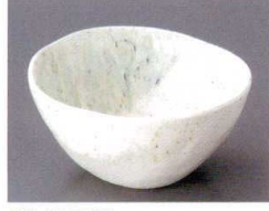
80-27-722 あいタタラボール鉢 1,100円 13.3×13×6.6cm 07911721