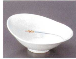
80-8-692 穂楕円小鉢(有田焼) 1,600円 16×12×5.5cm 5入 06616691