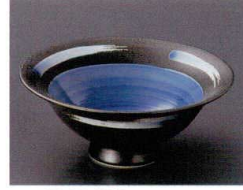
80-18-212 黒ルリ刷毛反型4.0鉢 1,300円 14×5.8cm 07612211