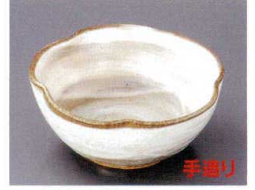
80-20-682 刷毛目花型小鉢 1,200円 13×5.3cm 07914681