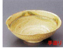
80-24-682 黄瀬戸四ツ押小鉢 1,180円 14×4.8cm 07813681