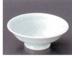
80-23-512 青白磁4.0平鉢 1,200円 12.8×4.5cm 08011511