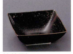
80-30-772 黒釉13.6cm正角鉢 1,000円 13.6×13.6×4.6cm 06909771