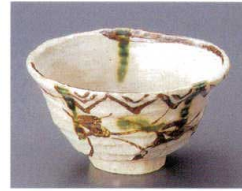
80-9-632 田舎絵小鉢 1,550円 13×7cm 80入 07809631