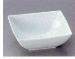
80-29-772 淡青13.6cm正角鉢 1,000円 13.6×13.6×4.6cm 06908771