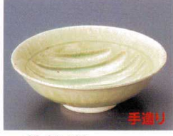
80-26-682 ビイドロソギ目小鉢 1,140円 14×4.7cm 07814681