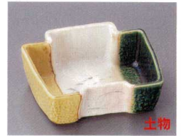
80-5-702 三彩芦変形角小鉢 2,000円 13.7×12×4.5cm 07904701