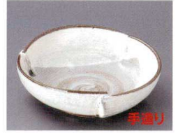
80-15-682 地黒トジメ小鉢 1,370円 14.5×4cm 06806681