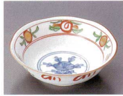
80-7-362 金丸紋浅鉢 1,700円 14×4.5cm 08007362