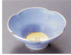
80-12-692 五稗金(紫)花型小鉢(有田焼) 1,500円 13.5×5.5cm 5×16入 07713691