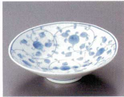
80-1-692 ばらの舞平鉢(有田焼) 3,000円 15.4×14.8×4.4cm 3入 08001692