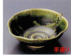
80-19-682 織部葉型小鉢 1,270円 14×13.5×5.2cm 07613681