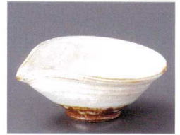
80-10-562 粉引片口小鉢 1,500円 14.2×12.5×6cm 07907561