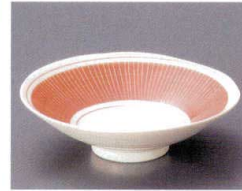
80-4-692 絹十草(赤)平鉢(有田焼) 2,000円 15.4×14.8×4.4cm 3入 08004692