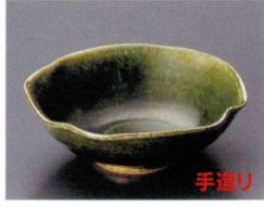
80-21-682 織部四ツ曲げ小鉢 1,200円 13.5×4.8cm 07913681