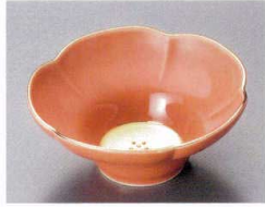
80-11-692 五稗金(赤)花型小鉢(有田焼) 1,500円 13.5×5.5cm 5入 07714691