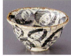
80-13-632 内外うず小鉢 1,400円 13×7cm 80入 07810631