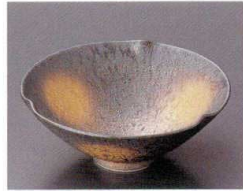
80-2-692 黒ゆず結晶金彩三方なぶり小鉢(有田焼) 2,750円 14.5×5.5cm 5入 07702691