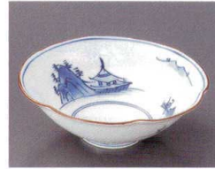
80-3-692 洗琳山水なぶり平小鉢(有田焼) 2,350円 15×5cm 5入 07607691