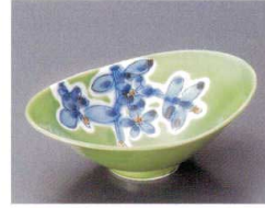
80-14-692 緑花楕円小鉢(有田焼) 1,400円 13.5×9×6cm 5入 07812691