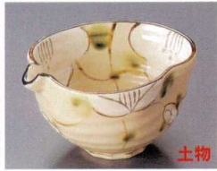
80-6-552 格子花片口4.0小鉢 1,710円 13.8×13×7cm 07704551