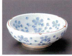
80-17-692 梅花話小鉢(有田焼) 1,350円 13.5×4.5cm 5×16入 07909691