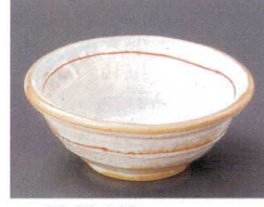
80-28-792 晴美4.5鉢 1,100円 14×5.5cm 07616791