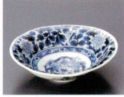
80-16-692 濃唐紋小鉢(有田焼) 1,350円 14.5×4cm 5入 07712691