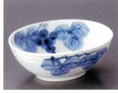
80-22-692 京ぶどう小判鉢(中)(有田焼) 1,200円 12.5×10×6cm 5入 06811691