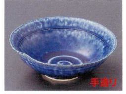
80-25-682 紺灰二ツ押小鉢 1,140円 14×4.8cm 07815681