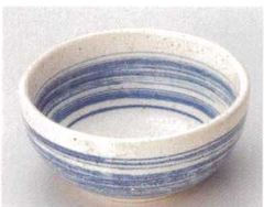
83-26-732 呉須刷毛目4.0ボール 650円 12.7×5.5cm 08027731