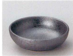
83-7-162 いぶし黒4.8ボール 1,200円 14.6×5cm 07008161