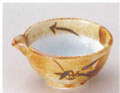
83-25-302 茶笹青釉片口小鉢 700円 13×11×6cm 08026301