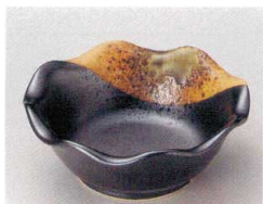
83-27-622 雅花型4.0小鉢 640円 12.3×4.6cm 100入 08124621