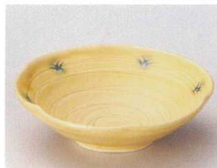
83-22-712 黄瀬戸草紋花型平鉢 770円 13.7×4cm 08322712