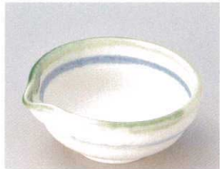
83-20-212 グリン流し片口小鉢 780円 13×12.5×5.5cm 08116211