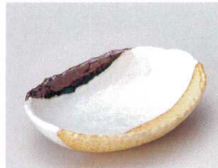
83-19-712 アメ塗分5.0舟型ボール 800円 15.3×11.5×3cm 08319712