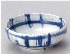
83-16-522 ササラ格子4.5取鉢 850円 13×4.7cm 06914521