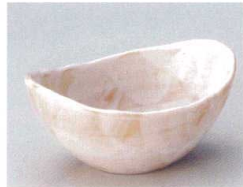
83-14-352 赤志野玉型鉢小 1,000円 14.7×11×6.8cm 06816351