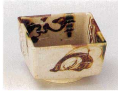
83-3-582 サビ織部流角小鉢 1,700円 9.3×9.2×5.8cm 08705581