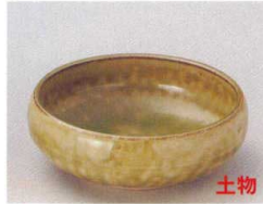
83-8-522 灰釉4.0くりボール 1,150円 12.5×12.5×4.5cm 08308522