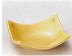
83-2-362 黄瀬戸角小鉢 1,700円 12.5×12.5×4.5cm 08105361