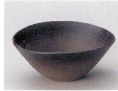
83-4-052 炭化すげ笠小鉢 1,700円 14.5×13.2×6cm 07706051