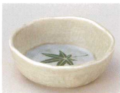
83-28-582 紅葉ビードロ小鉢 630円 13×4cm 08328582