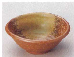
83-24-262 備前風吹織部中鉢 750円 13.6×13×5.3cm 580入 07821261