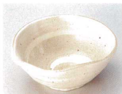
83-29-722 渦刷毛片口4.0鉢 600円 13.5×12.5×5.5cm 08329722