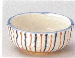
83-5-112 一珍十草4.0鉄鉢 1,480円 12.3×5cm 08008111