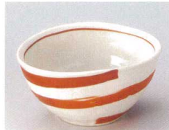
83-12-252 ラセン赤楕円4.5鉢 1,150円 12.8×10.8×6cm 08016251