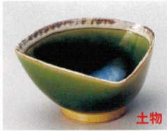
83-1-712 渚志野織部三角鉢(大) 1,760円 12.5×12.5×6.6cm 08103711