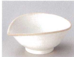
83-17-622 鍍ボカシなぶり5.0鉢 860円 15.3×12.7×6.3cm 10104621