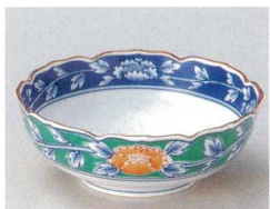
83-30-692 緑濃牡丹小鉢 600円 13×4.5cm 10×8入 08129691