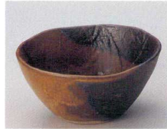
83-9-722 備前タタラボール鉢 1,100円 13.3×13×6.6cm 07912721