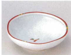
83-18-692 錦小花小鉢(有田焼) 850円 13.5×4cm 5入 07919691