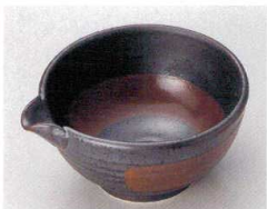
83-21-732 黒釉刷毛目片口小鉢 770円 13×11×6cm 08025731