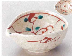
83-15-352 手描万曆4.0片口小鉢 930円 14.4×11.5×6.2cm 07916351