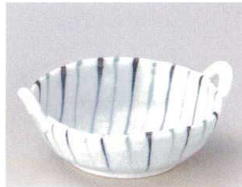
83-13-732 グリンストライプ手付小鉢 1,100円 13.5×11.5×5cm 08313732