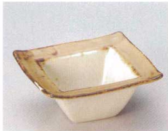
83-11-502 回角小鉢(駱駝) 1,100円 11.5×4.8cm 08311502