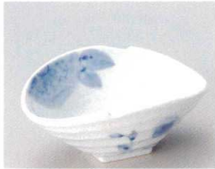
83-6-012 手描き藍花たわみ小鉢 1,400円 14.3×11.5×6cm 08306012