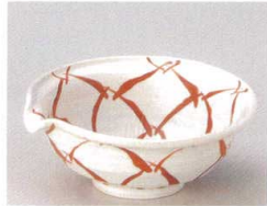
83-10-212 粉引内外網片口4.0鉢 1,150円 13.3×5.3cm 07915211