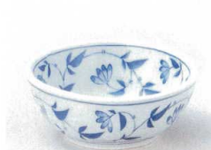
89-23-202 手描唐草4.0ボール 590円 11.5×4.6cm 08520201