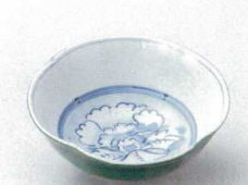
89-10-162 青交趾牡丹4.0小鉢 1,400円 11.6×4.9cm 08504161