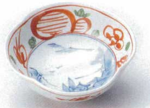
89-11-162 赤絵山水4.0小鉢 1,400円 11.6×4.9cm 08506161