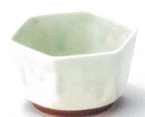
89-24-212 緑釉六角小鉢 480円 10×9.5×6cm 08921211