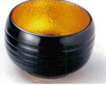
89-3-552 黒釉内金吹4.0小鉢 2,250円 10×7cm 08703551