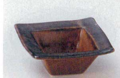
89-18-502 回角小鉢(鉛) 1,100円 11.5×4.8cm 08918502