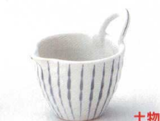
89-22-522 十草手付片口小鉢(中国製) 720円 10×9.7×7.3cm 69714521