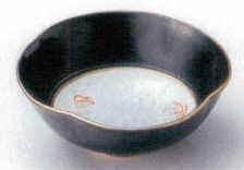
89-12-162 鉄砂蝶4.0小鉢 1,400円 11.6×4.9cm 08508161