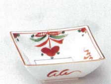
89-7-362 赤絵花角小鉢 1,500円 11×11×4cm 08907362