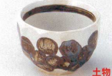
89-20-202 唐津錆紋小鉢 800円 10×6.9cm 08817201