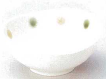
89-29-372 ドットまゆ型3.5鉢 280円 10.8×10.4×4.6cm 10121371