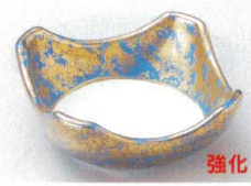
89-5-792 金彩輪花4.0角小鉢 1,700円 11×11×4.4cm 08605791