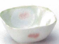
89-19-282 カトリアピンクなで角小鉢 850円 11.5×5.2cm 100入 08919282