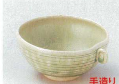
89-8-682 ビードロ手付小鉢 1,500円 12×11.5×5.6cm 08408681