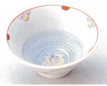
89-4-272 唐草見込福文字反小鉢 2,000円 11.8×5.3cm 08405271