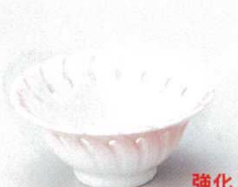
89-6-702 ピンク吹かごめ3.6小鉢 1,550円 11×4.9cm 08613701