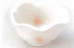
89-28-212 萩志野花型小付 370円 10.3×5.4cm 09026211