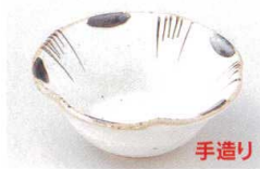
89-13-682 粉引サビ曲辺小鉢 1,270円 11.5×5cm 08510681