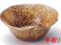
89-14-682 備前花型小鉢 1,160円 11.5×5.2cm 08511681