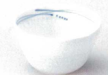
89-17-502 シュプール小鉢 1,100円 10×5.7cm 09116501