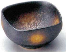
89-1-692 黒ゆず結晶金彩四方なぶり小鉢(有田焼) 2,400円 11.5×11.5×6cm 5入 08401691