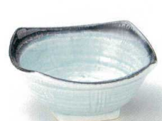
89-25-752 トルコ青磁小鉢 470円 11.3×5.2cm 08524751