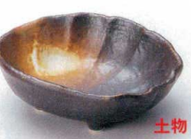
89-26-752 備前貝型小鉢 380円 12.5×10.5×4.5cm 07429751