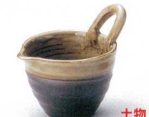
89-21-522 黒灰釉手付片口小鉢(中国製) 720円 10×9.7×7.3cm 69713521