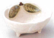
89-27-212 萩志野ゆず小鉢 370円 11×9.5×5.5cm 07527211