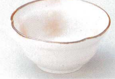
89-30-052 薄紅桜3.3小鉢 260円 10.8×5.3cm 08927051