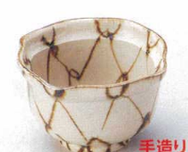
89-9-682 アミ絵入角小鉢 1,470円 11×6.5cm 08505681