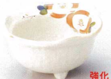
89-16-052 錦花絵イングレースミツ足小付(小) 1,120円 10.5×5.5cm 08916052