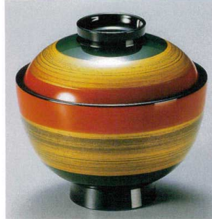
9-123-2 ¥2,250 祥 隅丸椀 三色ぼかし TA φ102×97 8-123-18