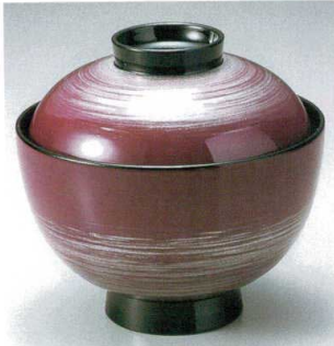
9-123-1 ¥2,250 祥 隅丸椀 紫銀パールかすみ TA φ102×97 8-123-17