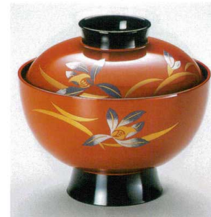
9-123-16 ¥3,550 3.5寸 反仙才小吸椀 朱蘭内黒 団 φ107×98 8-123-16