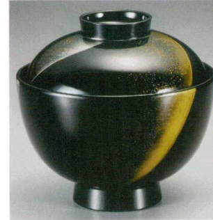
9-123-12 ¥2,950 祥 隅丸椀 黒金三色流し TA φ102×97 8-123-28