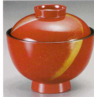
9-123-11 ¥2,950 祥 隅丸椀 朱金三色流し TA φ102×97 8-123-27