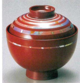
9-123-3 ¥2,500 祥 隅丸椀 箔散し朱光琳 TA φ102×97 8-123-19