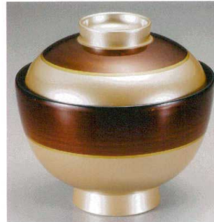
9-123-10 ¥2,250 祥 隅丸椀 銀透きべっ甲帯 TA φ102×97 8-123-26