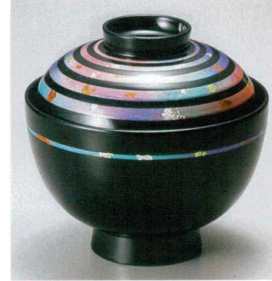
9-123-4 ¥2,500 祥 隅丸椀 箔散し黒光琳 TA φ102×97 8-123-20