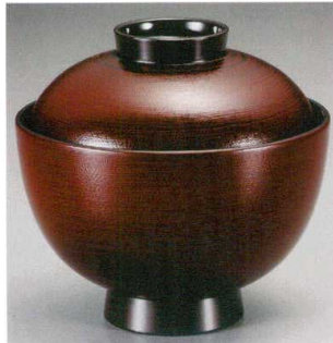
9-123-5 ¥1,800 祥 隅丸椀 溜刷毛目 TA φ102×97 8-123-21