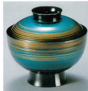
9-123-15 ¥2,550 3.5寸 反仙才小吸椀 エメラルド 団 φ107×98 8-123-15