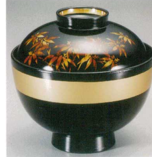
9-123-8 ¥2,300 祥 隅丸椀 金帯金笹 TA φ102×97 8-123-24