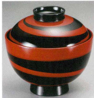
9-123-9 ¥2,150 祥 隅丸椀 黒鳴門 TA φ102×97 8-123-25