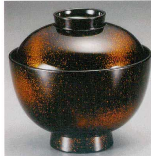
9-123-6 ¥2,000 祥 隅丸椀 新雲 TA φ102×97 8-123-22