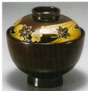
9-123-13 ¥2,200 祥 隅丸椀 溜立田川 TA φ102×97 12033336