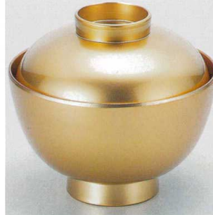
9-132-16 ¥2,900 新和 越前椀 総金 TA φ111×97 8-132-16