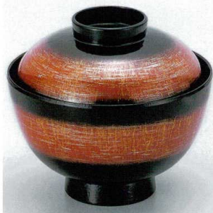
9-132-6 ¥3,000 新和 越前椀 朱銀布目調 TA φ111×97 8-132-6