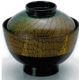
9-132-12 ¥3,600 新和 越前椀 緑新武蔵野 TA φ111×97 8-132-12