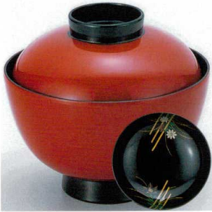
9-132-1 ¥2,800 新和 越前椀 朱ツバ黒 蓋見返し垣根 TA φ111×97 8-132-1