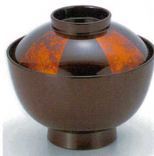
9-132-14 ¥3,150 新和 越前椀 白檀市松 TA φ111×97 8-132-14