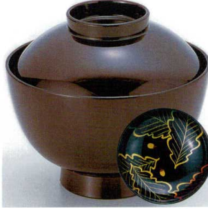
9-132-2 ¥3,250 新和 越前椀 新溜 蓋見返し柏 TA φ111×97 8-132-2