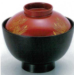
9-132-9 ¥2,600 新和 越前椀 日の出松 TA φ111×97 8-132-9