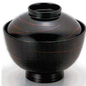
9-132-7 ¥3,150 新和 越前椀 渦曙内黒 TA φ111×97 8-132-7