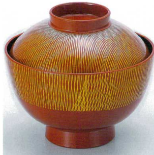
9-132-11 ¥3,600 新和 越前椀 朱新武蔵野 TA φ111×97 8-132-11