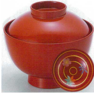
9-132-3 ¥2,850 新和 越前椀 朱 蓋見返し春秋 TA φ111×97 8-132-3