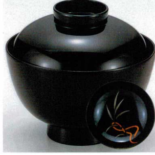
9-132-4 ¥3,150 新和 越前椀 黒 蓋見返し笹 TA φ111×97 8-132-4