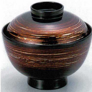
9-132-5 ¥2,900 新和 越前椀 溜金刷毛目 TA φ111×97 8-132-5