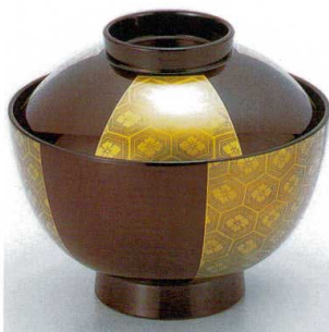
9-132-13 ¥3,350 新和 越前椀 溜金色紙 TA φ111×97 8-132-13