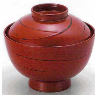
9-132-8 ¥3,150 新和 越前椀 渦根来内朱 TA φ111×97 8-132-8