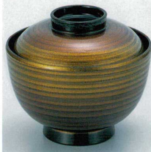
9-132-10 ¥3,000 新和 越前椀 変わり金ぼかし TA φ111×97 8-132-10