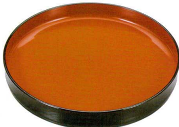
7寸 丸切立木目そば皿 黒内朱 9-322-23 本体 ¥850 [A] φ207×30 8-322-9 9-322-24 竹ス ¥380 [竹] φ198 8-322-9 9-322-25 PP竹ス ¥400 [PP] φ196 8-322-9