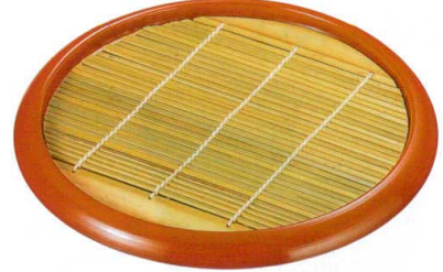
8寸 丸刷毛目そば皿 柿朱 9-322-11 本体 ¥750 [A] φ234×28 8-322-5 9-322-12 竹ス ¥380 [竹] φ198 8-322-5 9-322-13 PP竹ス ¥400 [PP] φ196 8-322-5