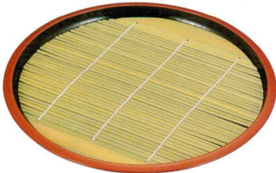
7寸 丸木目そば皿 黒天朱 9-322-5 本体 ¥700 [A] φ222×26 8-322-3 9-322-6 竹ス ¥380 [竹] φ198 8-322-3 9-322-7 PP竹ス ¥400 [PP] φ196 8-322-3