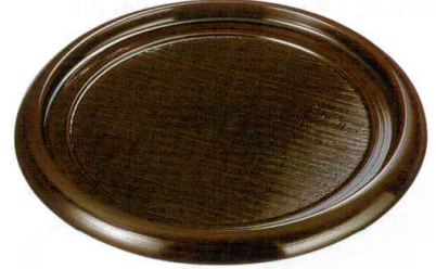
8寸 丸刷毛目そば皿 溜 9-322-20 本体 ¥950 [A] φ23 4×28 8-322-8 9-322-21 竹ス ¥380 [竹] φ198 8-322-8 9-322-22 PP竹ス ¥400 [PP] φ196 8-322-8