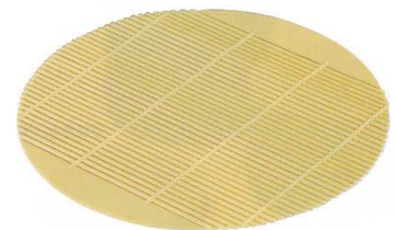
9-322-29 ¥400 PP丸竹ス [PP] φ196 8-322-11