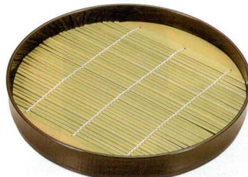
7寸 丸切立木目そば皿 新溜 9-322-26 本体 ¥900 [A] φ207×30 8-322-10 9-322-27 竹ス ¥380 [竹] φ198 8-322-10 9-322-28 PP竹ス ¥400 [PP] φ196 8-322-10