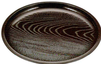
7寸 丸木目そば皿 新溜 9-322-14 本体 ¥850 [A] φ222×26 8-322-6 9-322-15 竹ス ¥380 [竹] φ198 8-322-6 9-322-16 PP竹ス ¥400 [PP] φ196 8-322-6