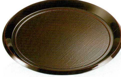
8寸 丸布目そば皿 溜 9-322-17 本体 ¥850 [A] φ232×30 8-322-7 9-322-18 竹ス ¥380 [竹] φ198 8-322-7 9-322-19 PP竹ス ¥400 [PP] φ196 8-322-7