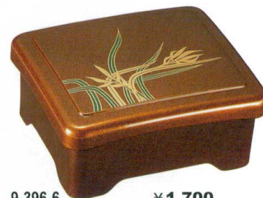
9-396-6 ¥1,700 光月井重 梨地蘭内朱 [A] 167×143×80 (143×119×46) 8-396-6