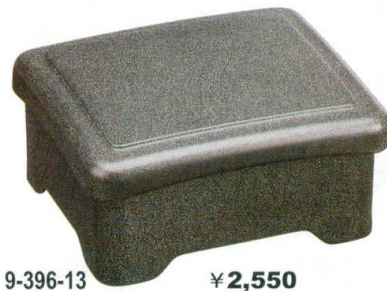
9-396-13 ¥2,550 光月井重 グレー乾漆内朱 [A] 167×143×80 (143×119×46) 8-396-15