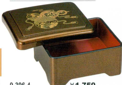
9-396-4 ¥1,750 光月井重 梨地ひょうたん [A] 167×143×80 (143×119×46) 8-396-4