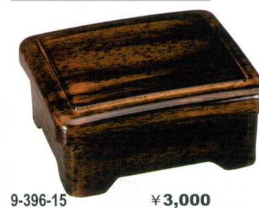
9-396-15 ¥3,000 光月井重 黒檀内朱GC塗 [A] 167×143×80 (143×119×46) 8-396-17