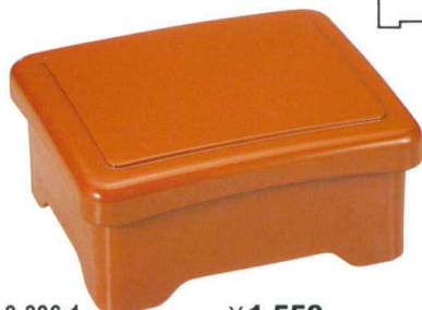
9-396-1 ¥1,550 光月井重 柿朱内朱 [A] 167×143×80 (143×119×46) 8-396-1