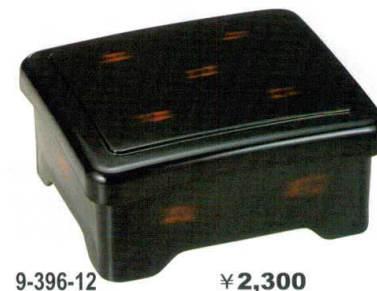
9-396-12 ¥2,300 光月井重 曙内朱 [A] 167×143×80 (143×119×46) 8-396-12