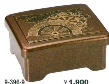
9-396-9 ¥1,900 光月井重 梨地御所車内朱 [A] 167×143×80 (143×119×46) 8-396-9