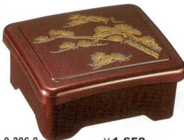
9-396-2 ¥1,650 光月井重 溜パール松内朱 [A] 167×143×80 (143×119×46) 8-396-2