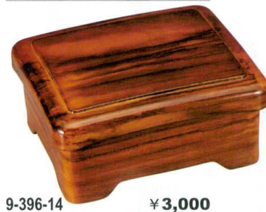
9-396-14 ¥3,000 光月井重 紫檀内朱GC塗 [A] 167×143×80 (143×119×46) 8-396-16