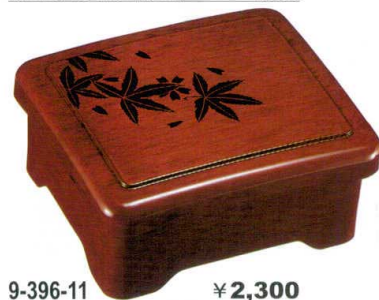
9-396-11 ¥2,300 光月井重 後藤塗紅葉内朱 [A] 167×143×80 (143×119×46) 8-396-11