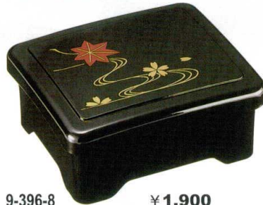
9-396-8 ¥1,900 光月井重 黒パール春秋内朱 [A] 167×143×80 (143×119×46) 8-396-8