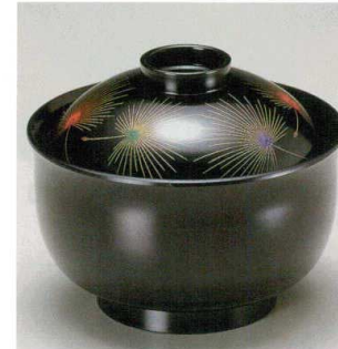
9-143-8 ¥2,800 3.8寸 ゆり型吸物椀 たんぽぽ [TA] φ113×91 8-143-8