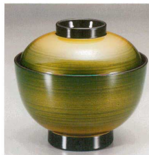
9-143-15 ¥3,900 3.6寸 保温小丸吸物椀 金グリーンかすみ [TA] φ108×100 8-143-15