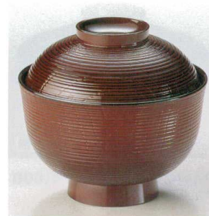
9-143-3 ¥1,600 3.6寸 百合木目吸物椀 溜 [類] φ109×101 8-143-3