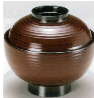
9-143-11 ¥2,250 4寸 乱引吸物椀 溜ツバ黒 [TA] φ117×102 8-143-11