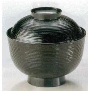
9-143-2 ¥1,550 3.6寸 百合木目吸物椀 黒 [類] φ109×101 8-143-2