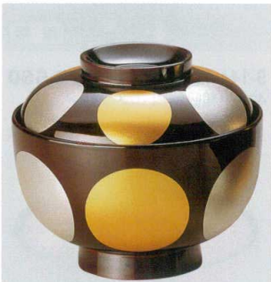
9-143-9 ¥4,700 詩季吸物椀 溜 日月 [類] φ110×93 8-143-9