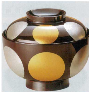
9-143-10 ¥4,900 詩季雑煮椀 溜 日月 [類] φ127×92 8-143-10