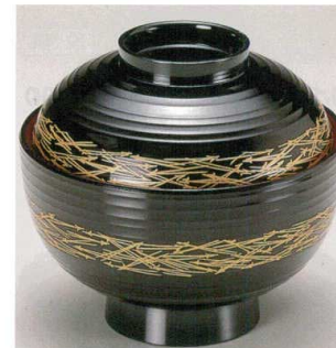
9-143-12 ¥2,900 4寸 乱引吸物椀 黒松葉帯内朱 [TA] φ117×102 8-143-12