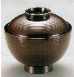
9-143-1 ¥1,900 3.8寸 刷毛目椀 チーク [M] φ110×99 8-143-1