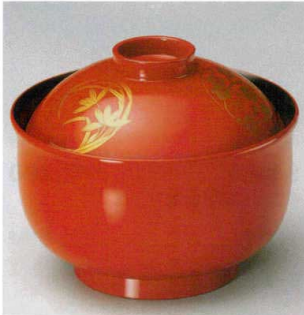
9-143-5 ¥3,000 3.8寸 ゆり型吸物椀 朱内黒四君子 [TA] φ113×91 8-143-5