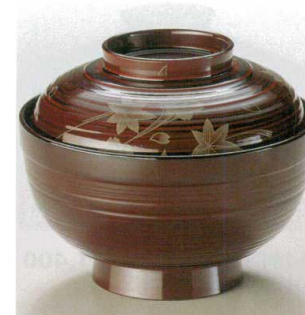
9-143-4 ¥2,600 4寸 帯付吸物椀 溜 春秋 [類] φ116×102 8-143-4