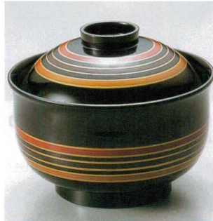
9-143-6 ¥2,900 3.8寸 ゆり型吸物椀 三色帯 [TA] φ113×91 8-143-6