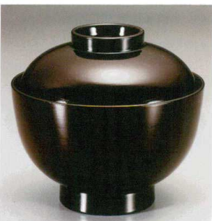
9-143-13 ¥3,400 3.6寸 保温小丸吸物椀 溜無地 [TA] φ108×100 8-143-13