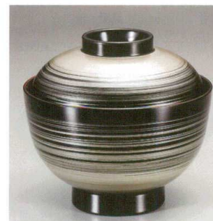
9-143-16 ¥3,900 3.6寸 保温小丸吸物椀 銀かすみ [TA] φ108×100 8-143-16