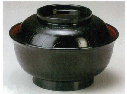
9-163-9 ¥1,900 神楽木目井 黒内朱 A φ159×105 8-163-9