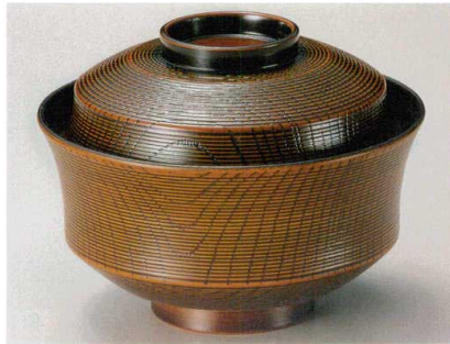
9-163-8 ¥2,100 5寸 ケヤキ井 栃内黒 M φ148×110 8-163-8