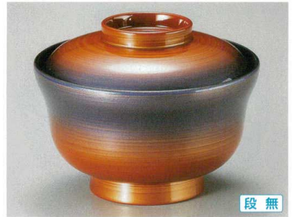
9-163-6 ¥2,450 4.5寸 かすみ椀 アメジスト TA φ135×104 8-163-6