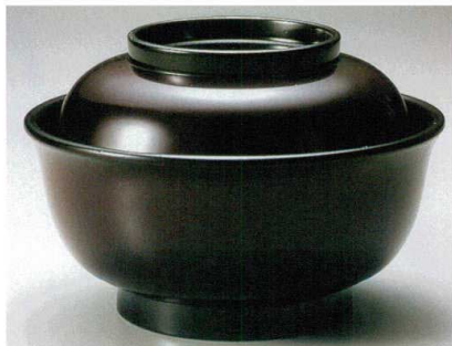
9-163-11 ¥2,200 神楽無地井 溜 A φ159×105 8-163-11