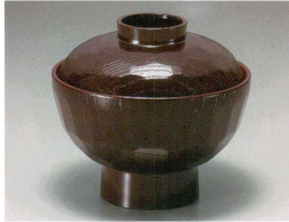
9-163-2 ¥1,600 耐熱亀甲井 (中) 新溜内朱 TA φ132×118 8-163-14