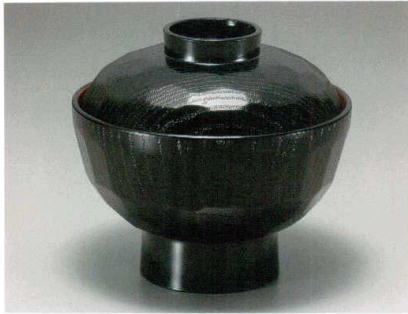
9-163-1 ¥1,400 耐熱亀甲井 (中) 黒内朱 TA φ132×118 8-163-13