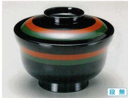
9-163-5 ¥2,200 4.5寸 かすみ椀 二色歌舞伎 TA φ135×104 8-163-5