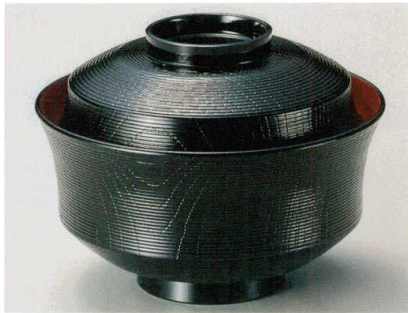
9-163-7 ¥1,800 5寸 ケヤキ井 黒内朱 M φ148×110 8-163-7