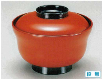
9-163-4 ¥1,980 4.5寸 かすみ椀 朱ツバ黒 TA φ135×104 8-163-4