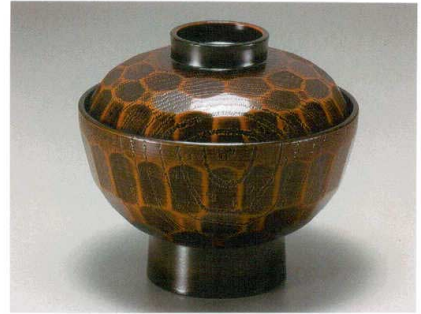
9-163-3 ¥1,900 耐熱亀甲井 (中) 栃内黒 TA φ132×118 8-163-15