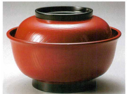
9-163-12 ¥2,250 神楽木目井 朱内黒 A φ159×105 8-163-12