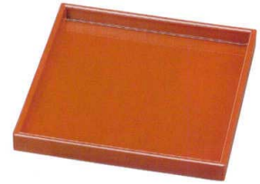
G-68-1 ¥1,300 6寸正角桂盛皿 オール柿朱 [A] 50000900 177×177×21