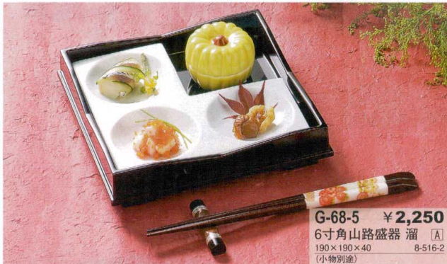
G-68-5 ¥2,250 6寸角山路盛器 溜 [A] 8-516-2 190×190×40 (小物別途)