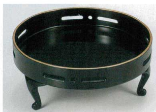
G-68-9 ¥2,750 猫足付6寸丸透かし盛器 黒天金 [A] 72-86-7 φ180×79