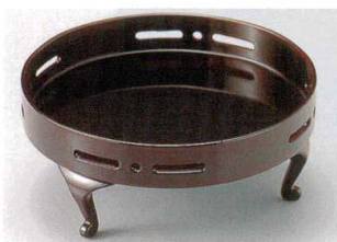
G-68-8 ¥3,450 猫足付6寸透かし盛器 溜 [A] 72-86-10 φ180×79