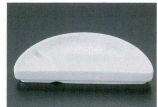
G-68-6 ¥2,300 有田焼6寸千代口付半月皿 太白 [陶] 72-86-5 170×85×18