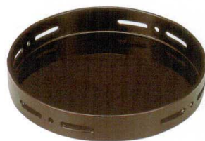
G-68-10 ¥1,850 6寸丸すかし盛器 溜 [A] 72-86-9 φ180×30