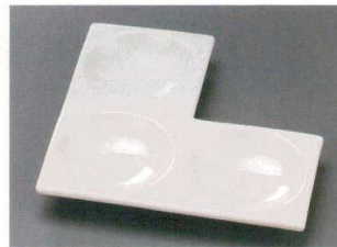
G-68-4 ¥3,200 有田焼L型 3点珍味皿 太白 [陶] 50000930 165×165×19