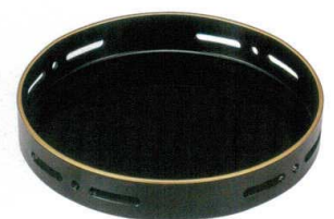
G-68-11 ¥1,650 6寸丸すかし盛器 黒天金 [A] 72-86-6 φ180×30