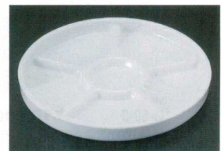
G-68-7 ¥2,900 有田焼6寸六つ切丸皿 太白 [陶] 72-86-8 φ170×18