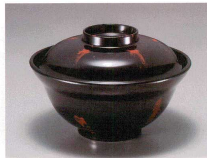
9-179-12 ¥1,950 日年井 (小) 曙 TM (蓋 ¥780, 身 ¥1,170) φ135×34 φ149×69 33023230