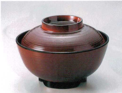
9-179-5 ¥2,100 千筋仙才椀 (大) 溜内黒 TM (蓋 ¥920, 身 ¥1,180) φ115×35 φ125×60 8-179-1