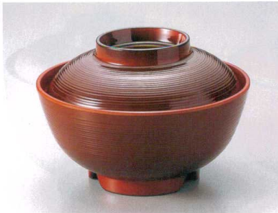
9-179-8 ¥2,100 千筋仙才椀 (大) 溜内朱 TM (蓋 ¥920, 身 ¥1,180) φ115×35 φ125×60 8-179-2