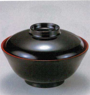
9-179-1 ¥1,700 かすみ吸物椀 (小) 黒内朱 TM (蓋 ¥730, 身 ¥970) φ111×29 φ119×52 8-178-14