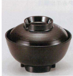
9-179-3 ¥1,950 千筋仙才椀 (小) 溜内黒 TM (蓋 ¥870, 身 ¥1,080) φ103×33 φ112×56 8-178-11