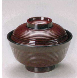
9-179-2 ¥1,950 千筋椀 (大) 溜 TM (蓋 ¥840, 身 ¥1,110) φ110×39 φ122×64 8-178-13