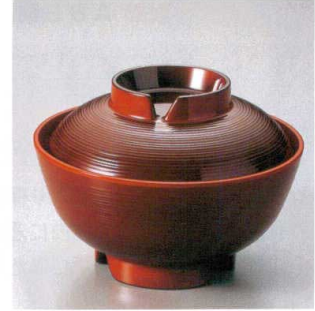
9-179-4 ¥1,950 千筋仙才椀 (小) 溜内朱 TM (蓋 ¥870, 身 ¥1,080) φ103×33 φ112×56 8-178-12