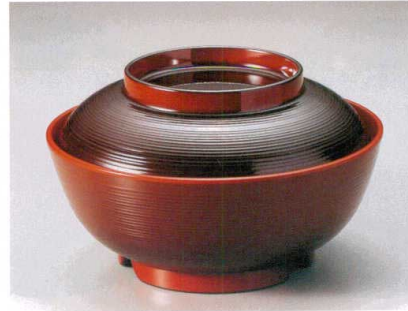
9-179-9 ¥2,400 千筋多用椀 溜内朱 TM (蓋 ¥1,070, 身 ¥1,330) φ137×35 φ145×60 8-179-5