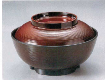
9-179-6 ¥2,400 千筋多用椀 溜内黒 TM (蓋 ¥1,070, 身 ¥1,330) φ137×35 φ145×60 8-179-4