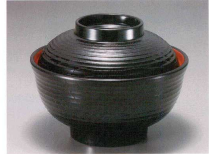
9-179-7 ¥3,900 筋木目 黒内朱 TM (蓋 ¥1,550, 身 ¥2,350) φ140×48 φ155×79 33023200