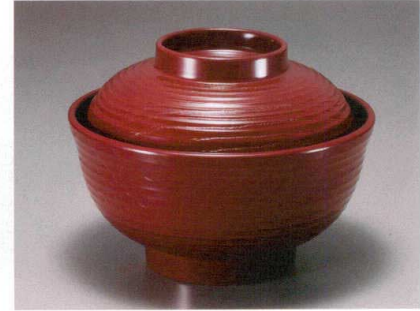
9-179-10 ¥3,900 筋木目 溜内朱 TM (蓋 ¥1,550, 身 ¥2,350) φ140×48 φ155×79 33023210