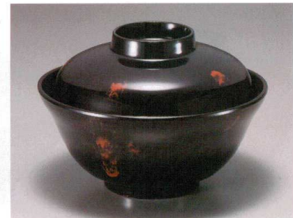
9-179-13 ¥2,150 日年井 (中) 曙 TM (蓋 ¥840, 身 ¥1,310) φ142×42 φ153×68 33023240