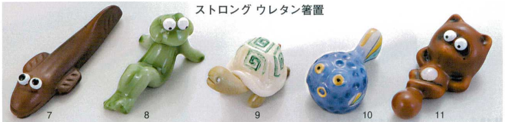
ストロング ウレタン箸置