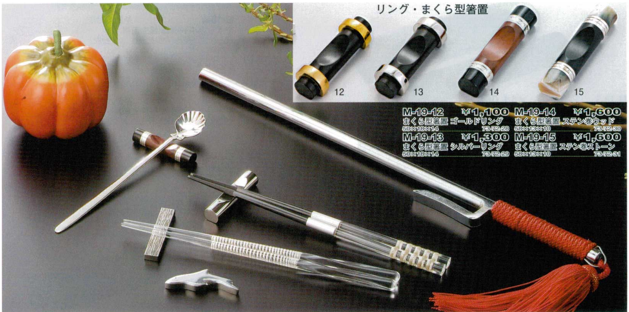
シルバーメタル箸置