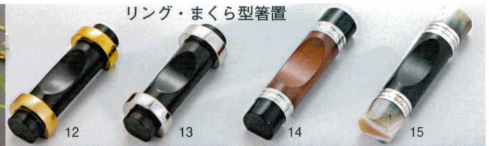
リング・まくら型箸置