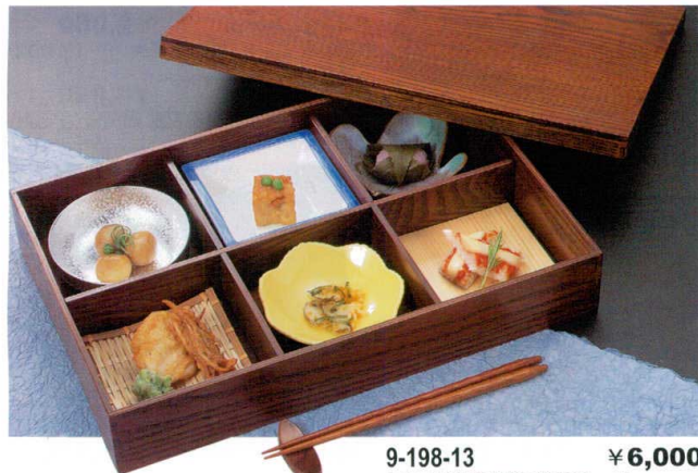
9-198-13 ¥6,000 尺3 木製松花堂 摺り漆 困 (仕切付) パーツ別 400×270×68 8-198-13