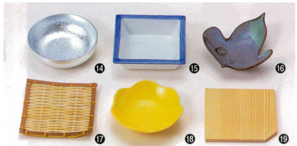
9-198-14 ¥1,600 アルミ丸鉢 AL φ110×32 8-198-14