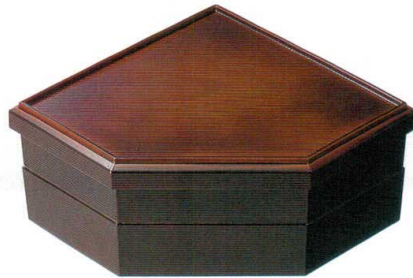
むすび松花堂 溜チーク内黒 [A] 9-231-12 蓋 ¥1,100 290×220×25 8-231-12 9-231-13 親 ¥1,500 275×210×53 8-231-13