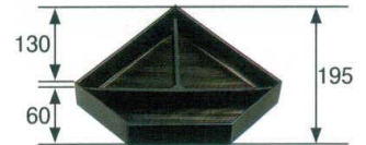
9-231-15 130 60 195 9-231-15 90 90 むすび松花堂用T字仕切 [A] ¥400 8-231-15