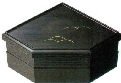
むすび松花堂 黒つゆ草 [A] 9-231-10 蓋 ¥1,150 290×220×25 8-231-10 9-231-11 親 ¥1,200 275×210×53 8-231-11