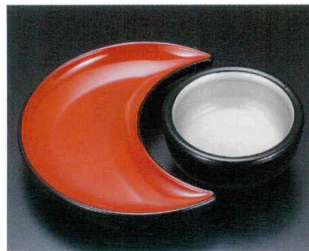
9-239-12 ¥850 三日月皿 朱天黒 [A] 114×99×26 8-239-12 9-239-13 ¥1,100 ミニがんこ鉢 銀粉蒔天黒 [A] 84×95 8-239-13