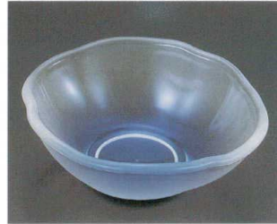
9-239-3 ¥1,250 4寸吉野鉢 ブルー [AC] 6Hコーティング 120×114×50 8-239-3