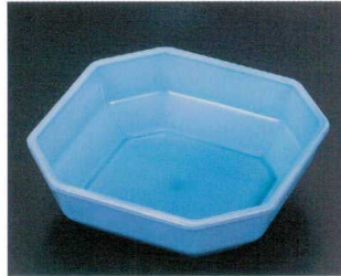
9-239-2 ¥1,450 八角鉢 青磁 [A] 115×115×38 8-239-2