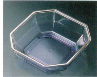
9-239-4 ¥1,350 八角鉢 ブルー天金 [AC] 115×115×38 8-239-4