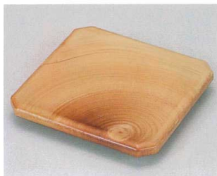
9-239-18 ¥1,000 面取り角皿 白木刷毛目 [A] 115×115×17 8-239-18