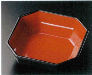
9-239-1 ¥950 八角鉢 朱天黒 [A] 115×115×38 8-239-1