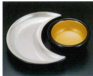
9-239-14 ¥1,300 三日月皿 銀粉蒔天黒 [A] 114×99×26 8-239-14 9-239-15 ¥1,100 ミニがんこ鉢 金粉蒔天黒 [A] 84×95 8-239-15