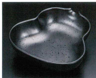
9-239-23 ¥1,300 お多福鉢 銀石目 [A] 114×114×33 8-239-23