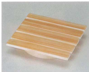
9-239-11 ¥950 角目皿 白木刷毛目糸尻SL [A] 111×111×20 8-239-13