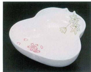
9-239-25 ¥2,100 お多福鉢 春秋 [A] 114×114×33 8-239-25