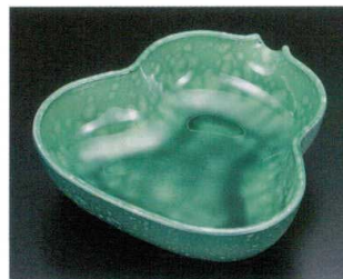
9-239-24 ¥1,350 お多福鉢 緑彩 [A] 114×114×33 8-239-24