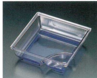
9-239-9 ¥1,200 タレ付角鉢 ブルー [AC] 114×114×35 8-239-9