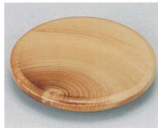
9-239-20 ¥1,000 面取り丸皿 白木刷毛目 [A] φ115×17 8-239-20