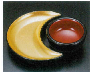
9-239-16 ¥1,300 三日月皿 金粉蒔天黒 [A] 114×99×26 8-239-16 9-239-17 ¥500 ミニがんこ鉢 朱天黒 [A] 84×95 8-239-17