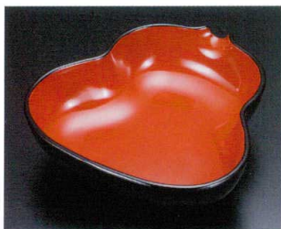
9-239-22 ¥900 お多福鉢 朱天黒 [A] 114×114×33 8-239-22