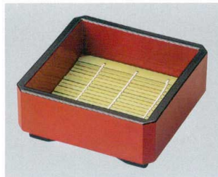
9-239-7 本体 ¥1,250 DX隅切ミニセイロ 朱天黒 [A] 110×119×47 8-239-7 9-239-8 ¥400 竹ス [竹] 84×95 8-239-8