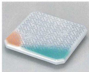
9-239-19 ¥1,300 面取り角皿 白磁春秋ぼかし [A] 115×115×17 8-239-19