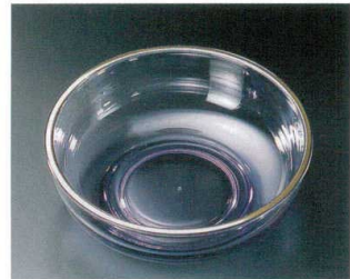
9-239-10 ¥1,350 円鉢 ブルー天金 [AC] φ113×35 8-239-10