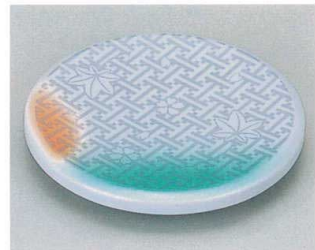
9-239-21 ¥1,300 面取り丸皿 白磁春秋ぼかし [A] φ115×17 8-239-21