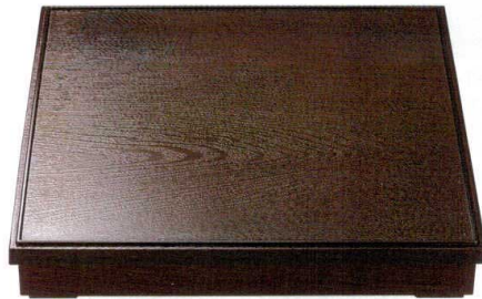
9-252-2 ¥5,500 尺3角木目松花堂 溜 [A] 仕切別 382×382×70 8-252-2