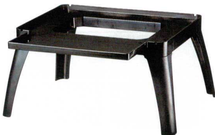
9-252-4 ¥3,500 尺3角松花堂専用台 [A] 395×410×225 8-252-4