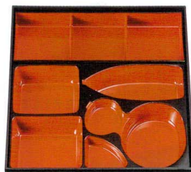
9-252-5 ¥1,000 セパレート三ツ切仕切 朱 [A] 351×114×40 8-252-5