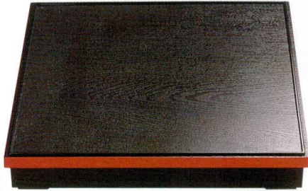
9-252-1 ¥4,850 尺3角木目松花堂 黒測朱 [A] 仕切別 382×382×70 8-252-1