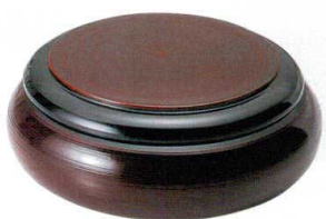
寿冠鉢ちらし 溜刷毛目内黒 [A] 9-454-9 本体 ¥1,450 φ175×58 8-454-9 9-454-10 蓋 ¥1,350 φ155×20 8-454-10