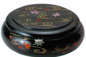
寿冠鉢ちらし 立田川内黒 [A] 9-454-17 本体 ¥2,050 φ175×58 8-454-17 9-454-18 蓋 ¥1,600 φ155×20 8-454-18