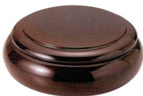
寿冠鉢ちらし 溜毘沙門天塗内黒 [A] 9-454-3 本体 ¥2,300 φ175×58 8-454-3 9-454-4 蓋 ¥1,400 φ155×20 8-454-4