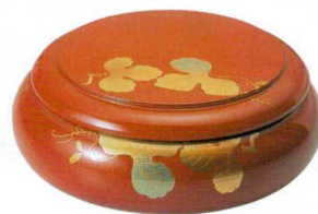
寿冠鉢ちらし 朱パール蔦絵内黒 [A] 9-454-19 本体 ¥2,500 φ175×58 8-454-19 9-454-20 蓋 ¥1,600 φ155×20 8-454-20