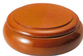
寿冠鉢ちらし 春慶塗内黒 [A] 9-454-27 本体 ¥1,600 φ175×58 8-454-27 9-454-28 蓋 ¥1,400 φ155×20 8-454-28