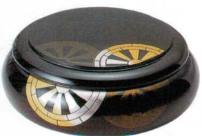
寿冠鉢ちらし 源氏車内黒 [A] 9-454-25 本体 ¥2,800 φ175×58 8-454-25 9-454-26 蓋 ¥3,000 φ155×20 8-454-26