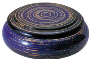
寿冠鉢ちらし かすみライン内黒 [A] 9-454-13 本体 ¥1,600 φ175×58 8-454-13 9-454-14 蓋 ¥1,450 φ155×20 8-454-14