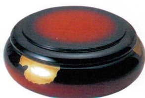
寿冠鉢ちらし ツブキ毘沙門天塗内黒 [A] 9-454-23 本体 ¥2,700 φ175×58 8-454-23 9-454-24 蓋 ¥1,550 φ155×20 8-454-24