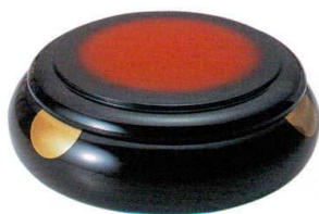
寿冠鉢ちらし 日月毘沙門塗内黒 [A] 9-454-21 本体 ¥2,450 φ175×58 8-454-21 9-454-22 蓋 ¥1,550 φ155×20 8-454-22