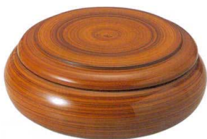
寿冠鉢ちらし 柀目内黒 [A] 9-454-5 本体 ¥1,500 φ175×58 8-454-5 9-454-6 蓋 ¥1,250 φ155×20 8-454-6