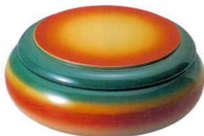
寿冠鉢ちらし 歌舞伎ぼかし内黒 [A] 9-454-15 本体 ¥1,700 φ175×58 8-454-15 9-454-16 蓋 ¥1,350 φ155×20 8-454-16