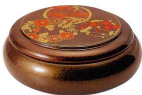
寿冠鉢ちらし 梨地花丸内黒 [A] 9-454-1 本体 ¥1,400 φ175×58 8-454-1 9-454-2 蓋 ¥1,450 φ155×20 8-454-2