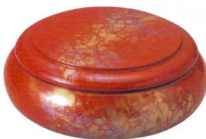
寿冠鉢ちらし 朱に八雲内黒 [A] 9-454-7 本体 ¥1,500 φ175×58 8-454-7 9-454-8 蓋 ¥1,300 φ155×20 8-454-8