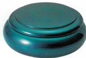
寿冠鉢ちらし エメラルド内黒 [A] 9-454-11 本体 ¥1,650 φ175×58 8-454-11 9-454-12 蓋 ¥1,350 φ155×20 8-454-12