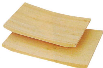
弓型長角盛台 白竹 罎 9-473-1 吋(中) ¥4,300 240×150×34 53252291 9-473-2 吋(大) ¥5,100 270×180×34 53252301