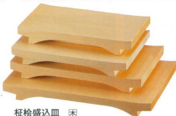
桧盛込皿 罎 9-473-8 吋(備用) ¥3,700 212×120×27 8-473-13 9-473-9 9寸 ¥4,500 212×151×27 8-473-14 9-473-10 10寸 ¥4,600 242×151×27 8-473-15 9-473-11 11寸 ¥5,600 271×181×27 8-473-16