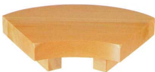
9-473-12 ¥5,000 扇面付台 罎 260×150×55 8-473-20