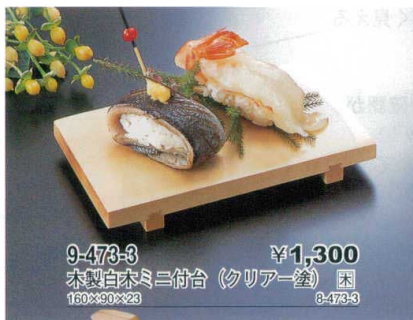
9-473-3 ¥1,300 木製白木三付台(クリアー塗) 罎 160×90×23 8-473-3