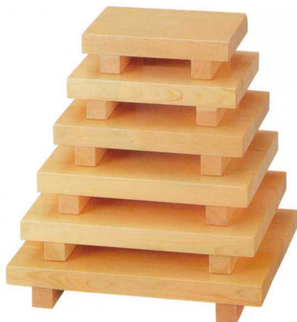
白木付台 罎 9-473-16 7寸 ¥3,250 210×150×60 8-473-21 9-473-17 8寸 ¥4,300 240×180×60 8-473-22 9-473-18 9寸 ¥7,400 270×210×60 8-473-23 9-473-19 尺0 ¥7,150 300×240×60 8-473-24 9-473-20 尺1 ¥10,000 330×270×60 8-473-25 9-473-21 尺2 ¥11,000 360×300×60 8-473-26