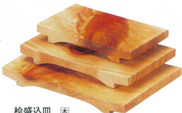
桧盛込皿 罎 9-473-5 7寸 ¥3,700 210×120×27 8-473-10 9-473-6 8寸 ¥4,550 240×150×27 8-473-11 9-473-7 9寸 ¥6,200 270×180×27 8-473-12