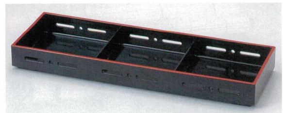
9-529-9 ¥1,650 尺3 長手三点透かし盛器 黒天朱 [A] 361×126×44 8-529-9