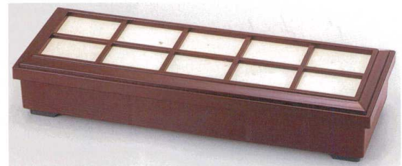
尺3 長手松花堂障子盛器 溜 [A] 9-529-7 蓋 ¥2,700 374×137×23 8-529-7 9-529-8 ミツ切本体 (木目内朱) ¥1,350 362×126×57 8-529-8