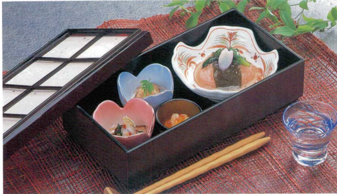
1/2松花堂障子盛器チーク溜 [A] 9-529-1 蓋 ¥1,950 258×140×22 8-529-1 9-529-2 本体 (千筋) ¥1,500 246×127×56 8-529-2