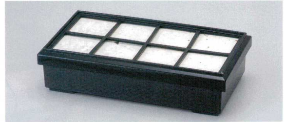
1/2松花堂障子盛器 黒 [A] 9-529-3 蓋 ¥1,800 258×140×22 8-529-3 9-529-4 本体 (千筋) ¥1,150 246×127×56 8-529-4