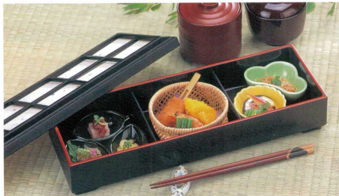
尺3 長手松花堂障子盛器 黒 [A] 9-529-5 蓋 ¥2,000 374×137×23 8-529-5 9-529-6 ミツ切本体 (木目天朱) ¥1,150 362×126×57 8-529-6