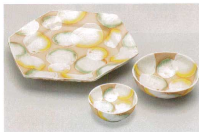
9-751-14 ¥5,000 7寸緑黄雪刷毛丸紋六角皿 (有田焼) 陶 215×190×32 8-751-34