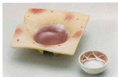
9-751-5 ¥4,800 4寸アミ格子四方深鉢 (有田焼) 陶 160×160×54 8-751-25