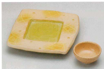
9-751-7 ¥5,000 黄編み格子角中彫和皿 (有田焼) 陶 192×190×32 8-751-27