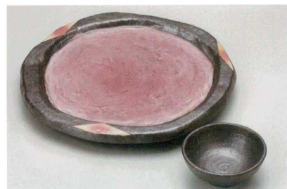
9-751-3 ¥5,000 6寸黒土楽マロン抜円測皿 (有田焼) 陶 212×205×27 8-751-23