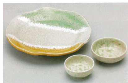
9-751-11 ¥5,000 7寸二色釉流波測皿 (有田焼) 陶 218×220×40 8-751-31