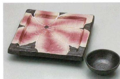
9-751-9 ¥5,000 黒土楽マロン花紋彫正角皿 (有田焼) 陶 177×170×32 8-751-29