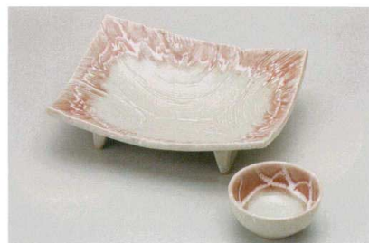
9-751-1 ¥4,800 渚辰砂雪格子流水四方向付 (有田焼) 陶 177×140×45 8-751-21